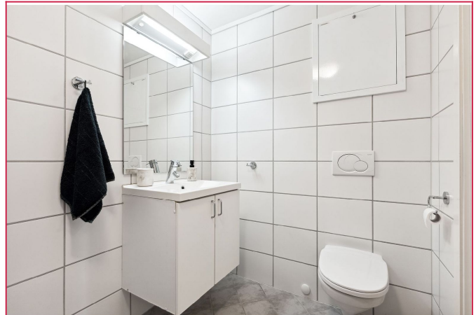
Helfisest Bad med servant, toalett, dusj og vaskemaskin.