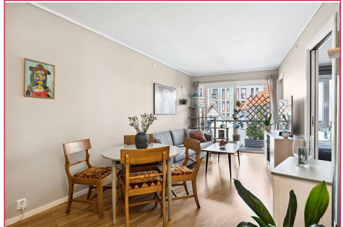
Stue/ kjøkken har en åpen løsning og fra stuen er det to skyvedører til soverommet, en på hver side.