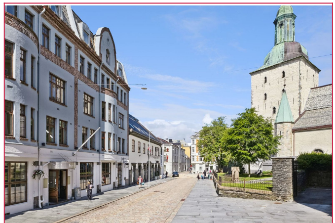
Velkommen til Kong Oscars gate! En trivelig gate rett ved Bergen Domkirke og andre severdigheter.