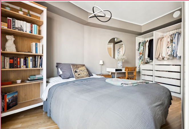
Soverommet har god utnyttelse med garderobe og plass til 140 seng og mer.