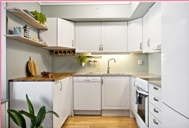
Romslig kjøkken med gode oppbevaringsmuligheter, alle hvitevarer og åpen løsning.