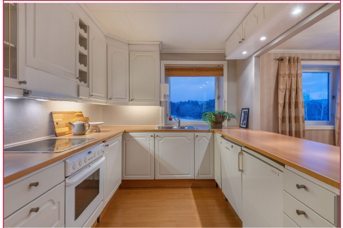
Lyst kjøkken med god skap-og benkeplass. Hviteware medfølger