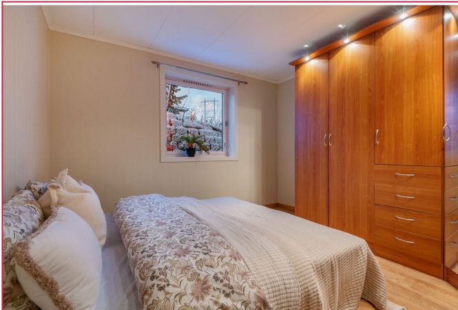
Soverommet er av god størrelse - garderobeskap medfølger