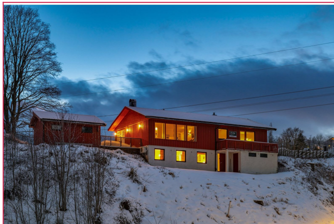
Fasade- Leiligheten har egen inngang fra nedsiden av huset, og disponerer en sportsbod ved inngangen