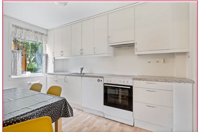
Kjøkkenet har godt med skaplass og spisegruppe for fire