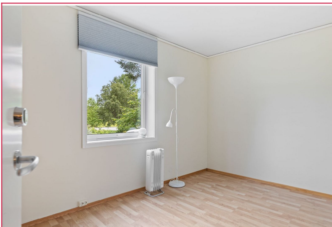
Det minste rommet er på 9,4 kvm og har god plass til seng, skrivepult og skap