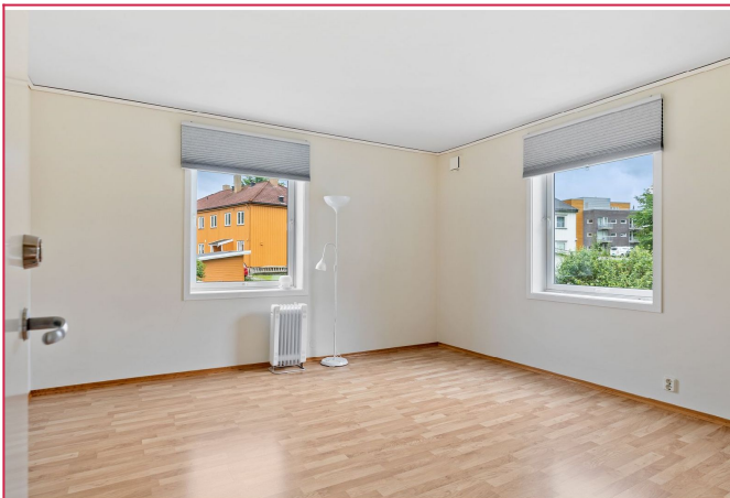
Det største soverommet er 15,3 kvm. Alle rom har store vindu med godt lysinnslipp.