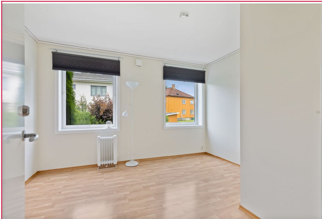
Stue innenfor kjøkkenet er på 11,5 kvm - kan leies som hybelrom på forespørsel