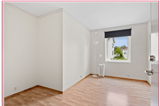
Midterste rom er på 11,3 kvm. Internett er inkludert i leien for alle.