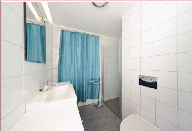
Pent, flislagt bad med dusjhjørne, toalett og vaskemaskin