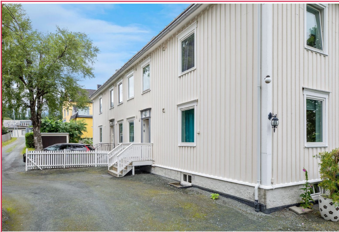
Pen fasade med mulighet for parkering utenfor