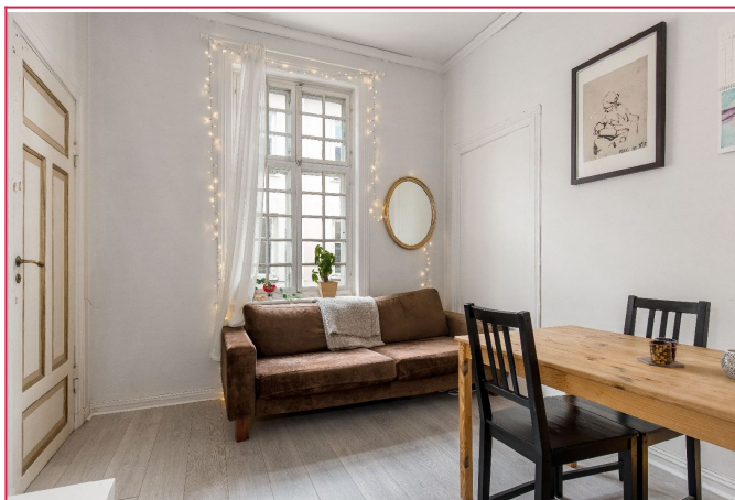
Stue med plass til det man trenger.