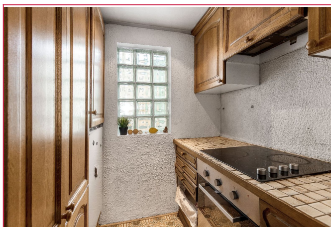
Kjøkken holder en eldre standard.