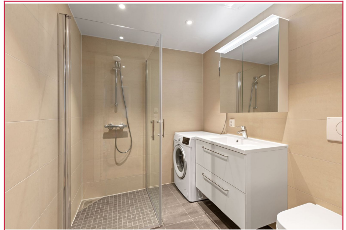
Vaskemaskin og gulvvarme inkludert