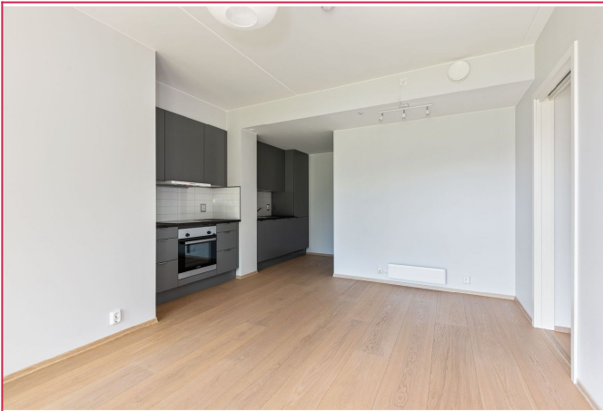
Flott leilighet med integrerte hvitevarer