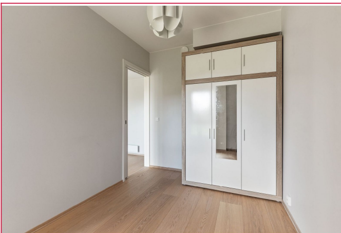
Soverom med garderobeskap