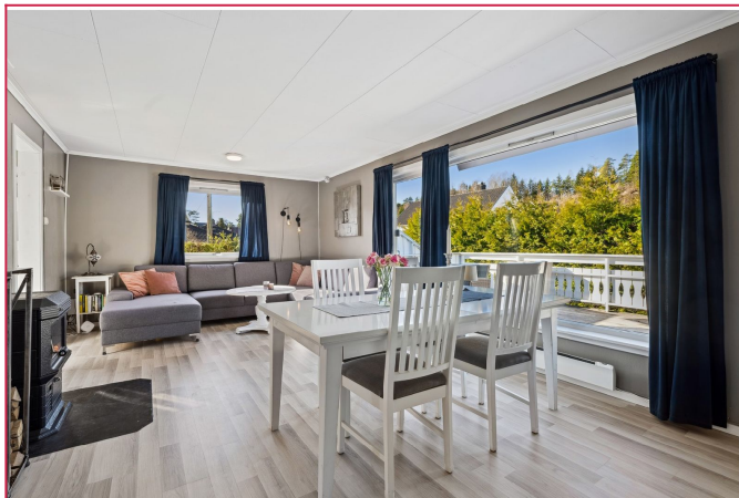
Stor og fin stue med direkte utgang til terrasse. Store vinduer som slipper inn mye lys