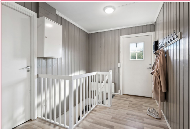
Gang med plass til yttertøy og sko