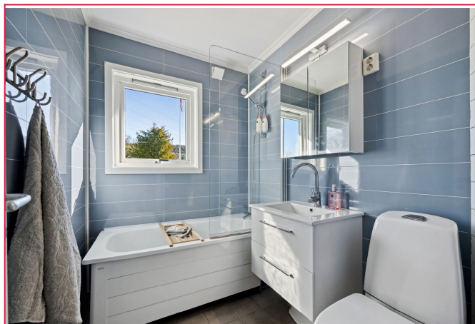
Pent bad med toalett, badekar og servant m/innredning