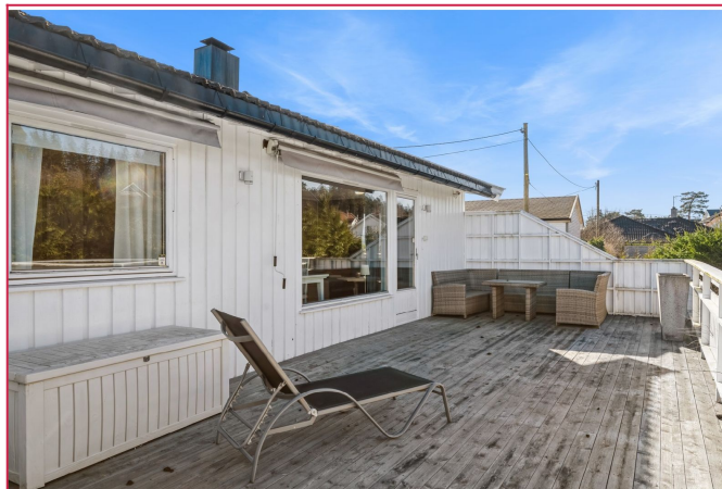
Stor og flott terrasse med gode solforhold