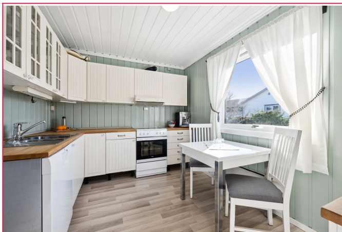
Kjøkken med mye skap- og benkeplass