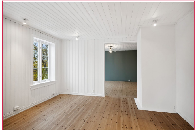
Lys og romslig stue