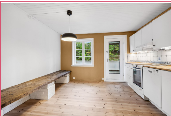
Kjøkkenet med komfyr og oppvaskmaskin - kombiskap kan kjøpes om ønskelig