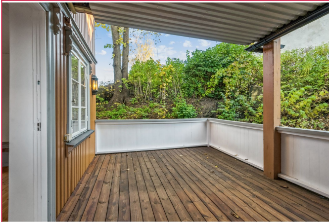
Terrasse på ca. 14 kvm