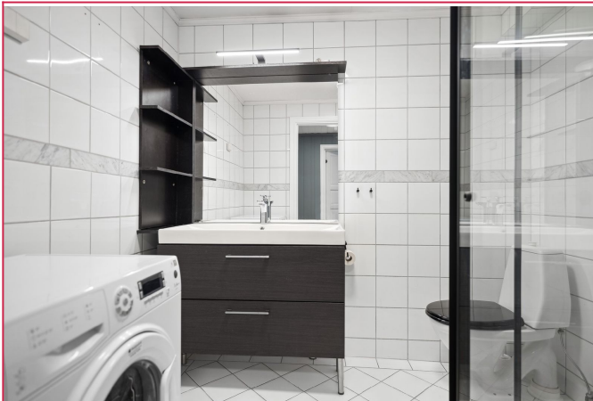
Flidlagt bad med varme i gulv og vaskemaskin