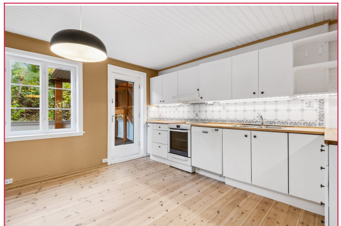
Kjøkkenet med utgang til terrasse