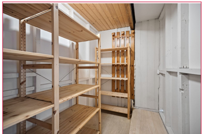
Innvendig bod tilknyttet soverom