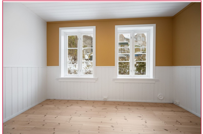
Soverom med innebygd garderobeskap og varme i gulv