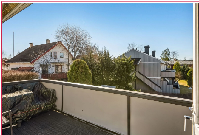
Balkong med fin utsikt mot fellesarealer, og hagemøbler som medfølger