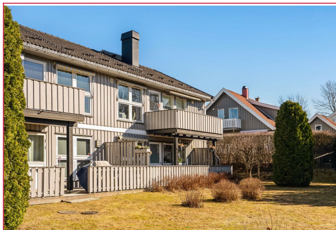
Velkommen til M Jul Halvorsens veg 7 D!