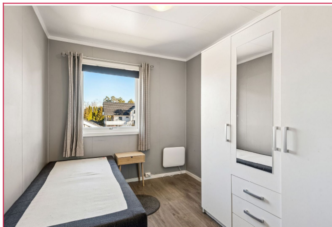
Soverom med garderobeskap og seng. Seng kan fjernes om ønskelig.