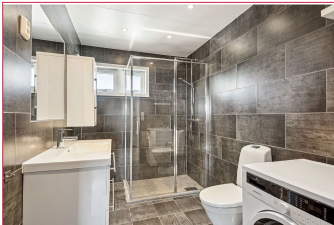
Lekker, nyoppusset bad med gulvvarme og godt med oppbevaring