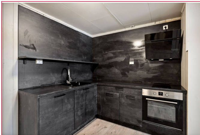
Kjøkkenet i underetasjen, tilsvarende kjøkkenet i overetasjen.

SAKSNUMMER 36273 - HØLANDSVEIEN 59, 1903 GAN