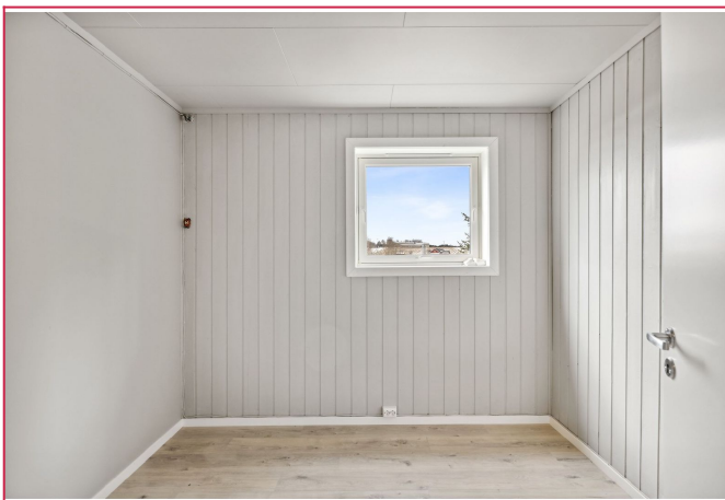
Boligen har 7 soverom til sammen. Det er skapplass i alle soverom.