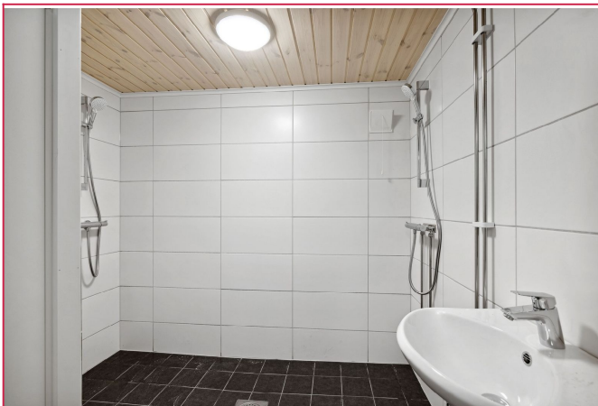
Badet i underetasjen som tilhører overetasjen. Det er satt inn dusjvegger mellom dusjene.