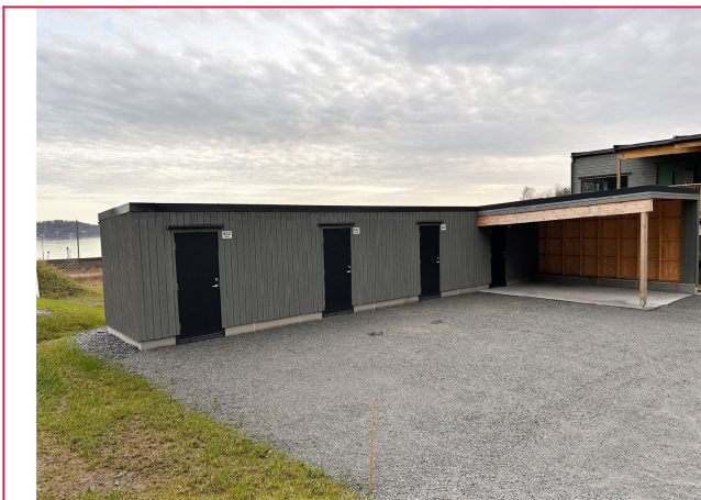
Det medfølger en utebod bak parkeringsplass