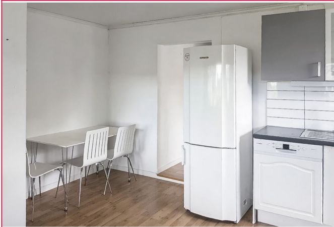
Åpen stue/kjøkkenløsning med plass til spisebord og stoler.