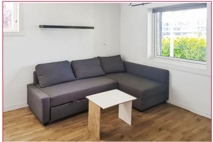
Stuen har et pent laminatgulv og stort vindu som gir mye dagslys. God plass til sofa og tv benk.