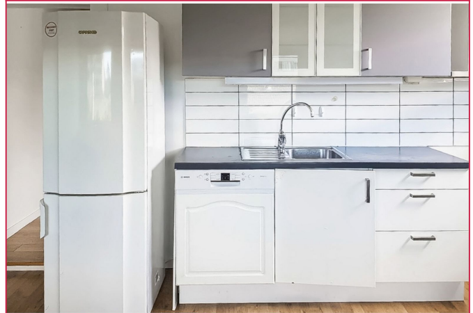
Praktisk kjøkken med integrert oppvaskmaskin og veggfliser. Oppbevaringsplass i over- og underskap.