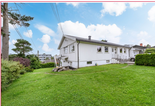
Stor hage i et rolig og barnevennlig område.