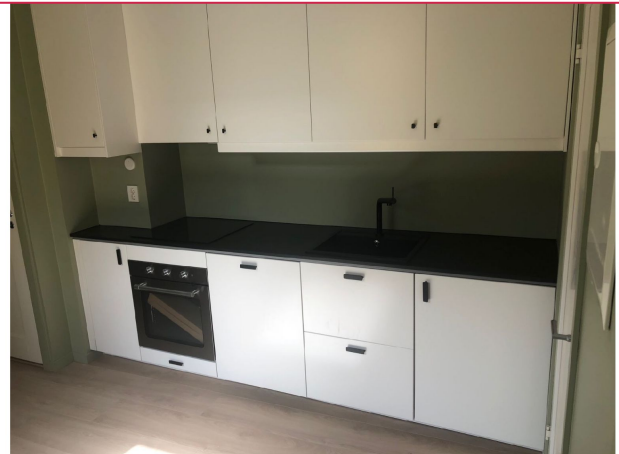
Nytt kjøkken med integrerte hvitevarer