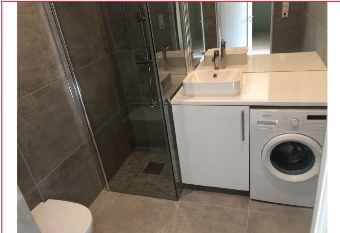
Nytt flislagt bad med vaskemaskin