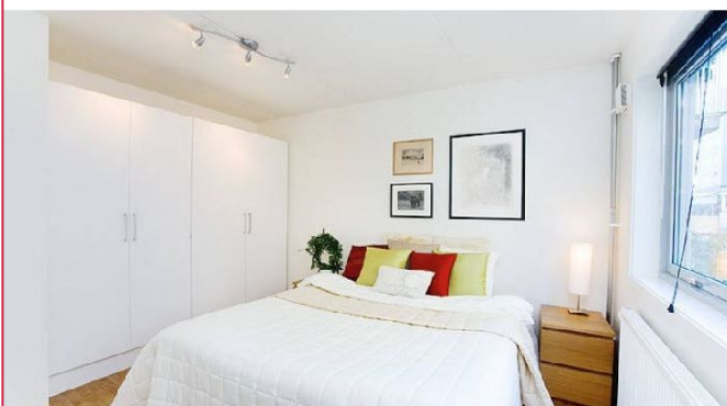
Soverom med god skapplass