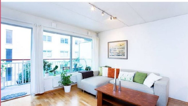
Sofakrok med utgang til stor balkong!