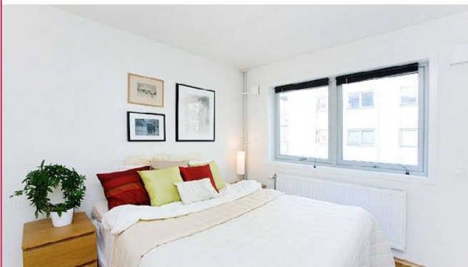
Soverom med plass til dobbeltseng