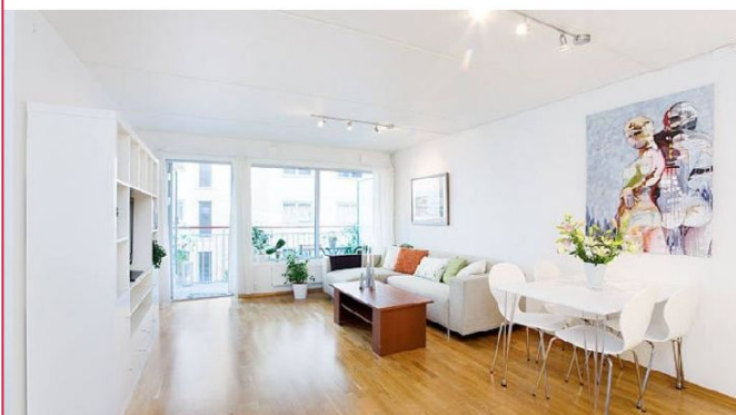
Stue med utgang til balkong.