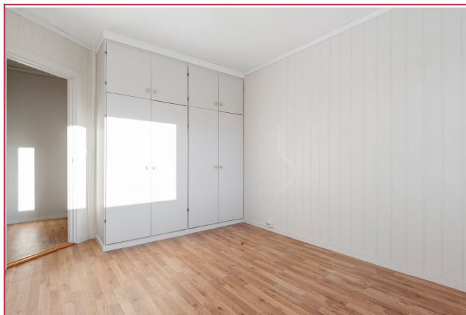
Totalt har leiligheten 3 soverom