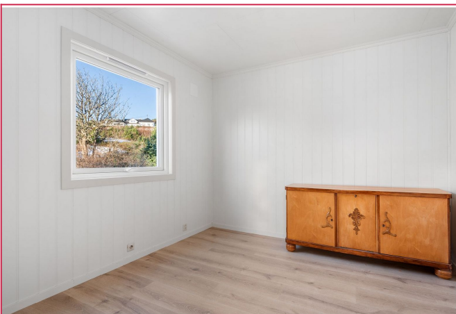
Aller rommen er lyse og har plass til seng og garderobeløsning