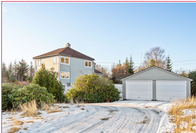
Det følger med en fast parkering i garasje