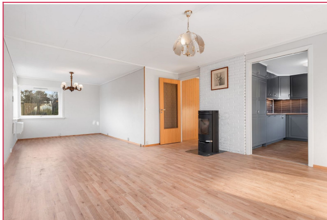
Stuen er lys og romslig og kan enkelt møbleres med sofagruppe og spisebord