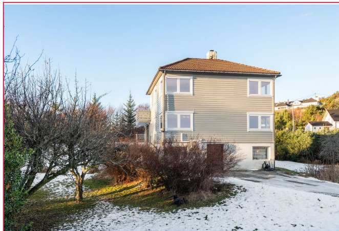
Velkommen til Sundvegen 1201 A!