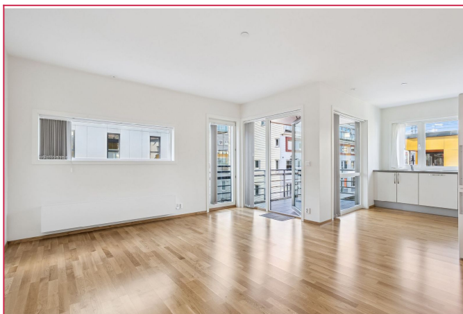
- Åpen stue- kjøkkenløsning med utgang til solrik balkong -