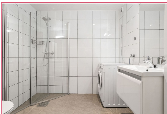
- Bad -