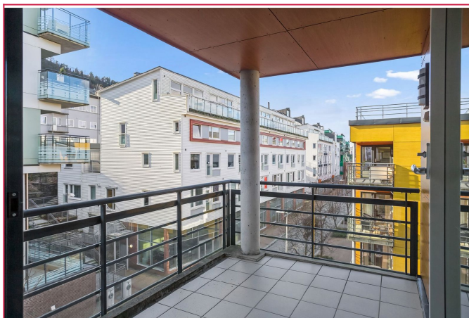
- Balkong -