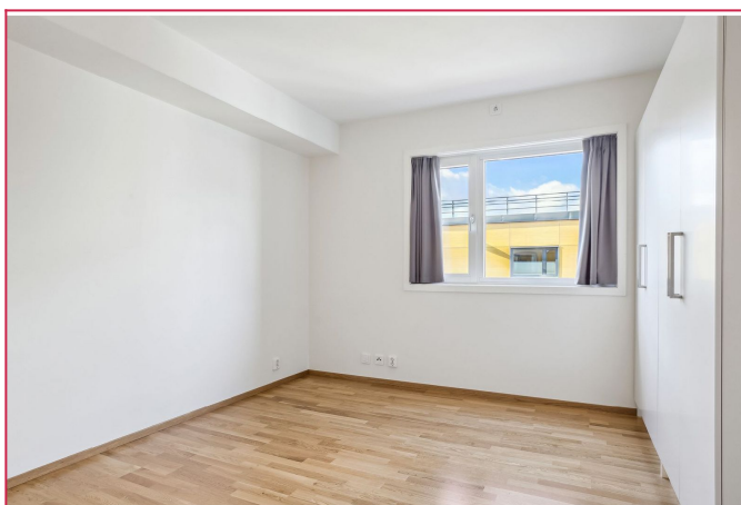
- Soverom med garderobeskap -