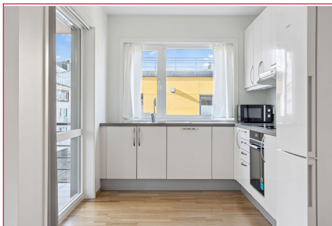
- Kjøkken -