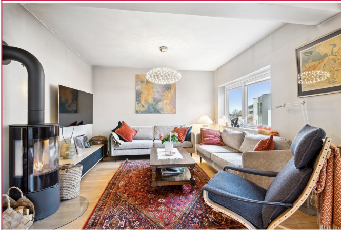
Stor stue med peis/ildsted