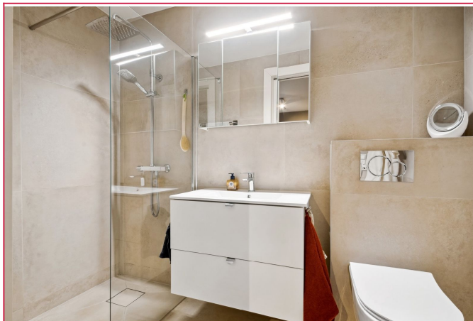
Bad inn fra hovedsoverom