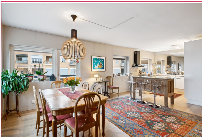
Spisestue med god plass