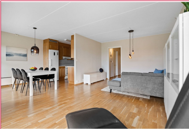
Stue og kjøkken i delvis åpen løsning