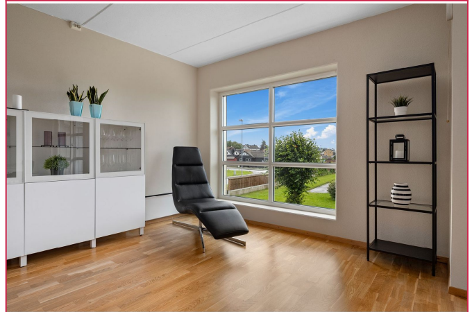
Store vindusflater i stue