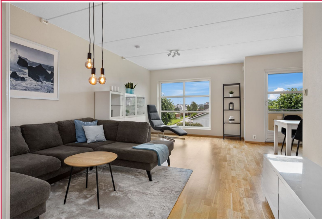
Stue med sofagruppe