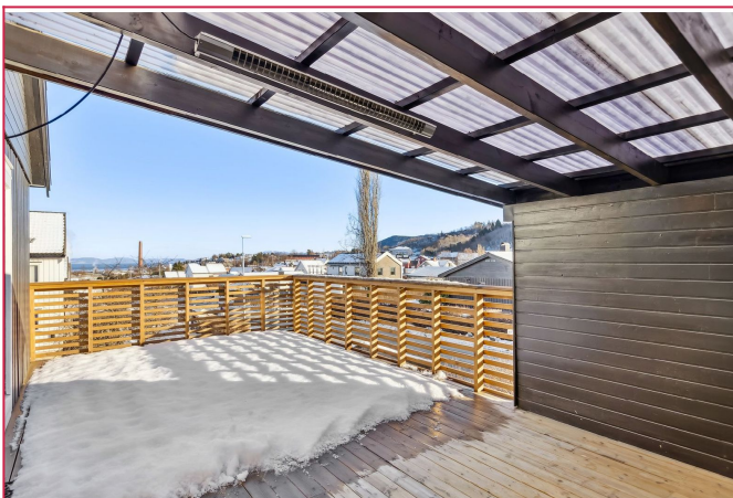
Romslig terrasse med rikelig lys- og solforhold.