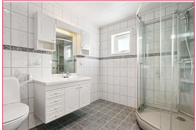
Flislagt bad med dusjkabinett.