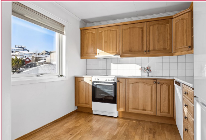
Kjøkkenet har rikelig med skap- og benkeplass.