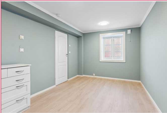
Fin 2-roms leilighet midt i byen! - 2 minutters gange til togstasjonen