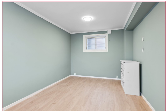
Stort soverom med god plass til både dobbeltseng og garderobe