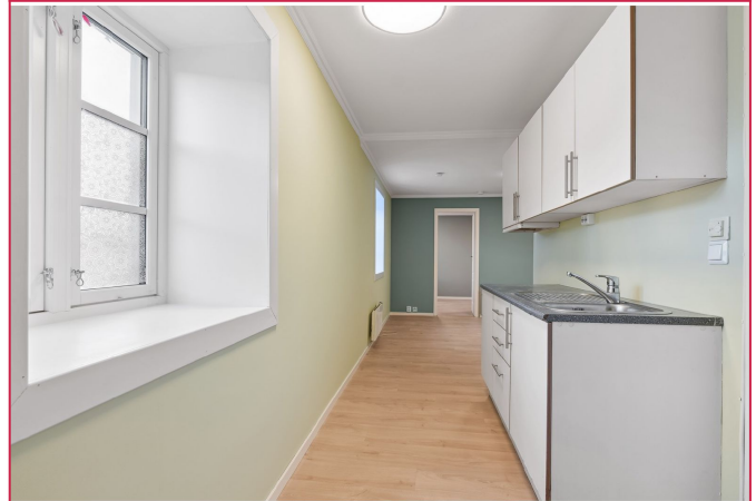
Kjøkkenet i hvite fronter med god skap- og benkeplass