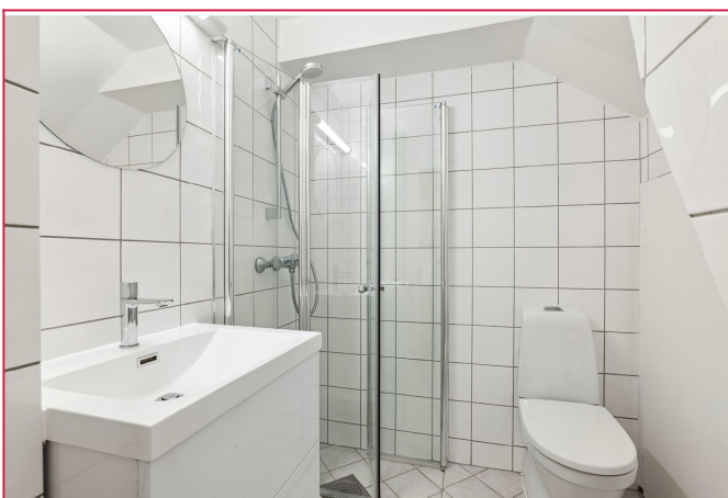
Flislagt bad med hjørnedusj, toalett og servant m/innredning