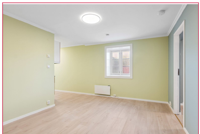
Velkommen til visning!