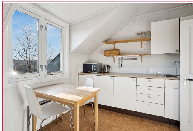
Lyst kjøkken med god skap- og benkeplass. Kjøkkenet er utstyrt med kjøleskap og komfyr.