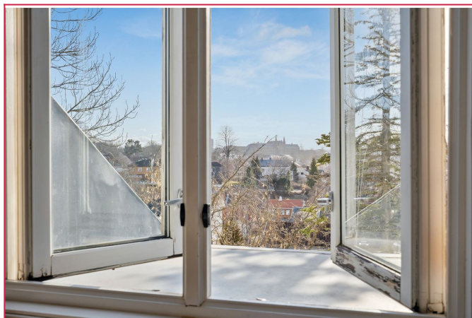
Flott utsikt retning Gløshaugen fra kjøkkenet.