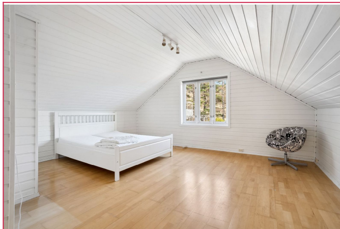
Lyst og luftig soverom av svært god størrelse.