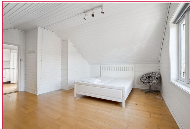
Soverommet er innredet med dobbeltseng, som også vil følge med leiligheten.