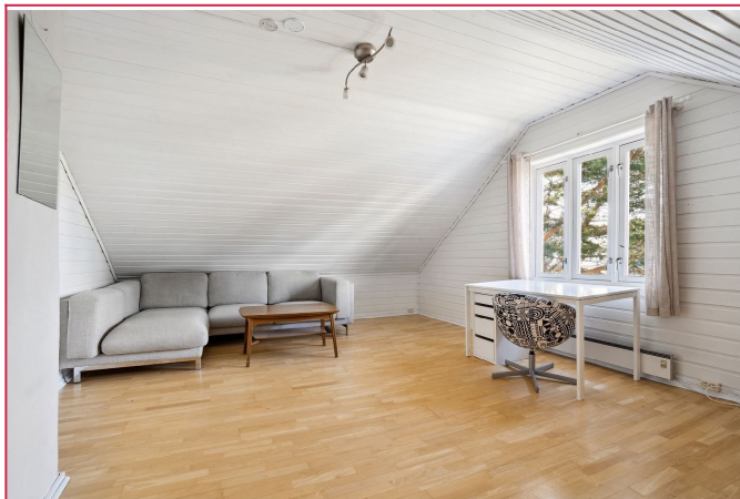
Stuen er også av god størrelse med god plass til ønsket møblement.