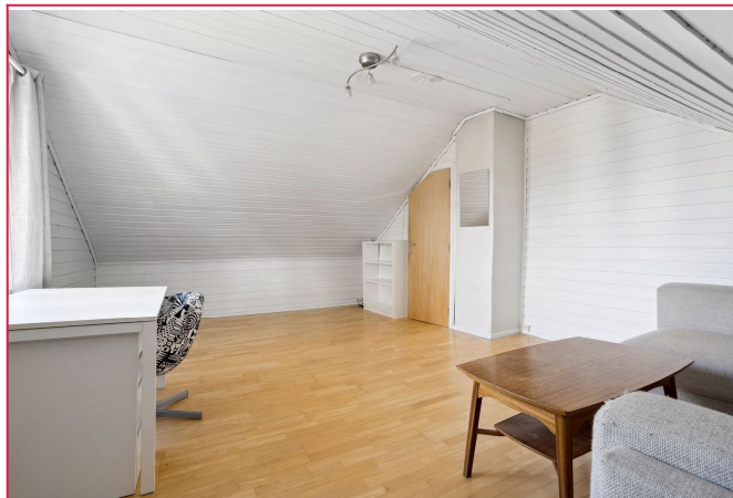
Stuen er innredet med sofa og tilhørende bord, samt en skrivepult.