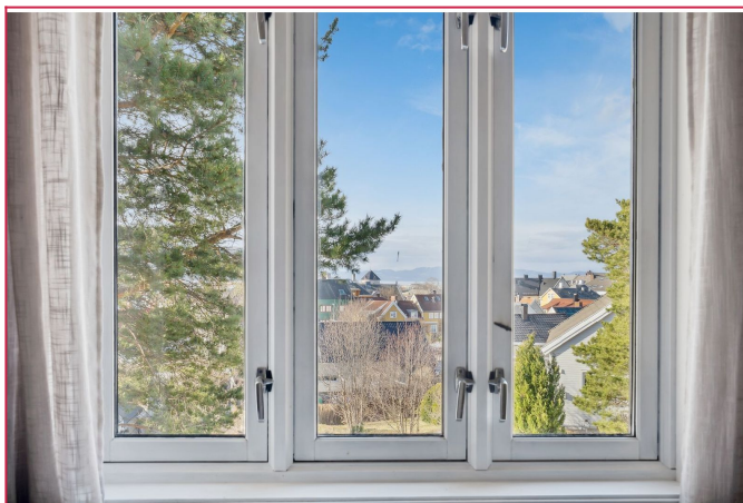
Utsikt over byen fra stuevindu.