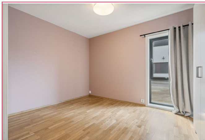
Stort soverom på hele 11 kvm, det er også en garderobeløsning med god plass til oppbevaring