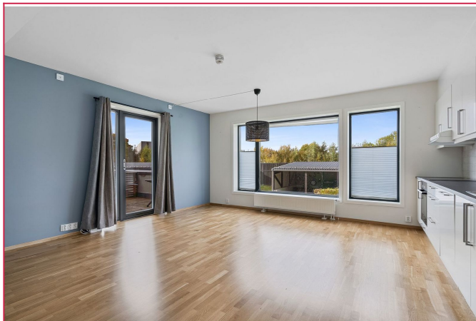
Her har du en romslig og åpen stue/kjøkkenløsning med direkte utgang til terrasse