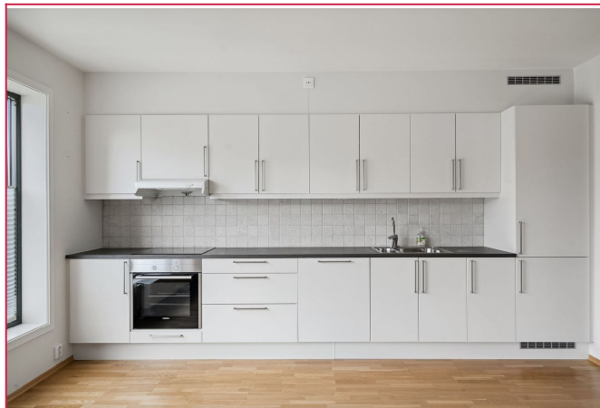
Kjøkkenet er av høy kvalitet, med alle hvitevarer integrert