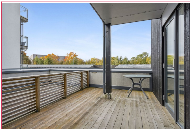
Terrassen er sørvest-ventd med gode solforhold!