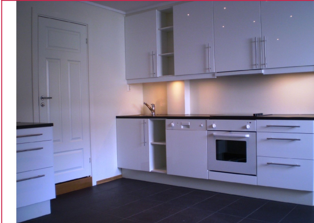
Kjøkkenet i hvite fronter og god skap og benkeplass.