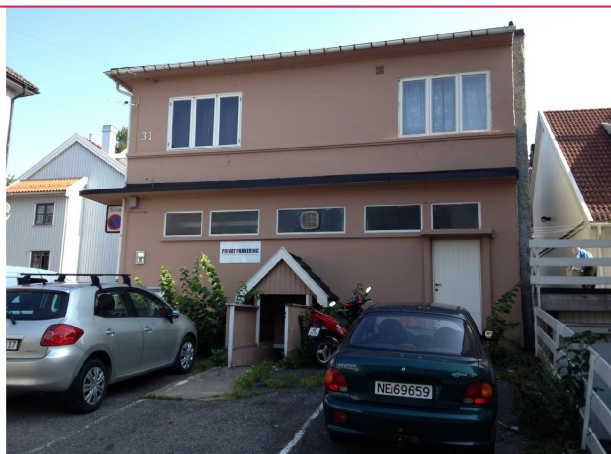
Velkommen til visning!