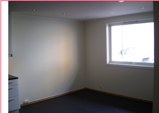
Åpen stue og kjøkkenløsning.