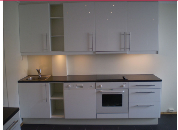
Hvitevarer: oppvaskmaskin, komfyr og steketopp.