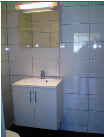
Flislagt bad med dusjkabinett, toalett og servant m/innredning.