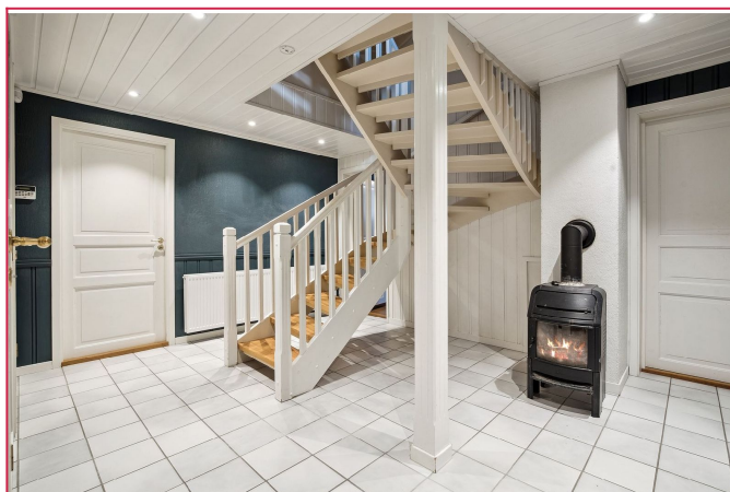
Rom i underetasje