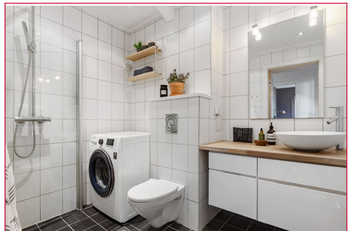
Pent flislagt bad med varmekabler i gulv og vaskemaskin. Pusset opp etter bildene ble tatt