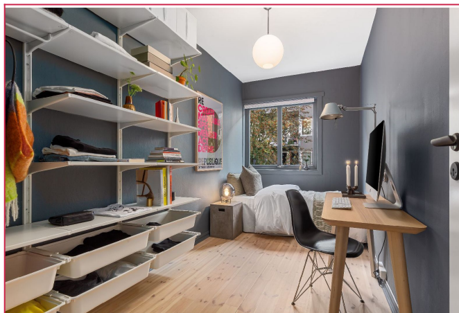
Soverom 2 har hyllesystem på veggen til oppbevaring, det er plass til dobbeltseng.