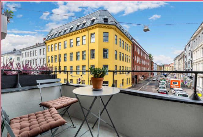
Balkongen mot enveiskjørt blindgate.