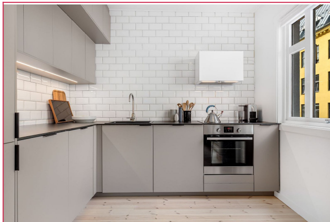
Kjøkken med integrerte hvitevarer