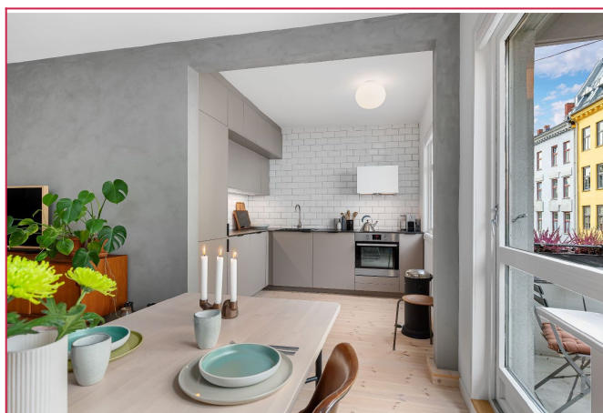
Romslig stue med utgang til balkongen.