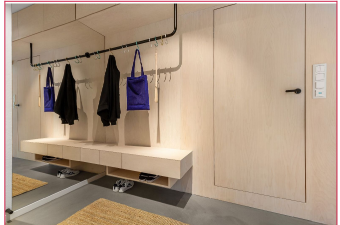
Spesialbygd innredning i entré