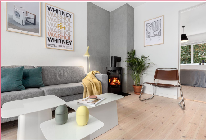
Stue med peisovn