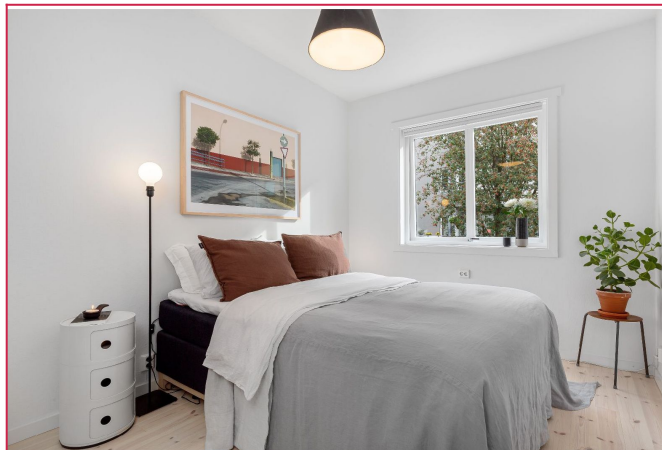
Lyst hovedsoverom med garderobeskap