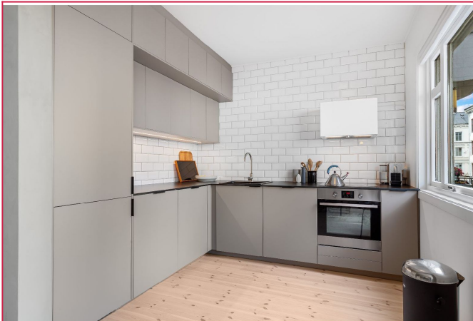
Takhøy kjøkkeninnredning fra 2019 med matte fronter og kompaktlaminat benkeplate.