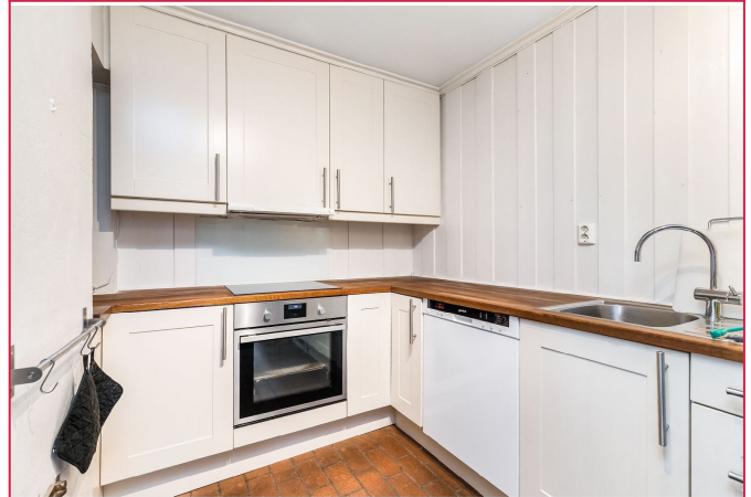
Kjøkken med hvitevarer