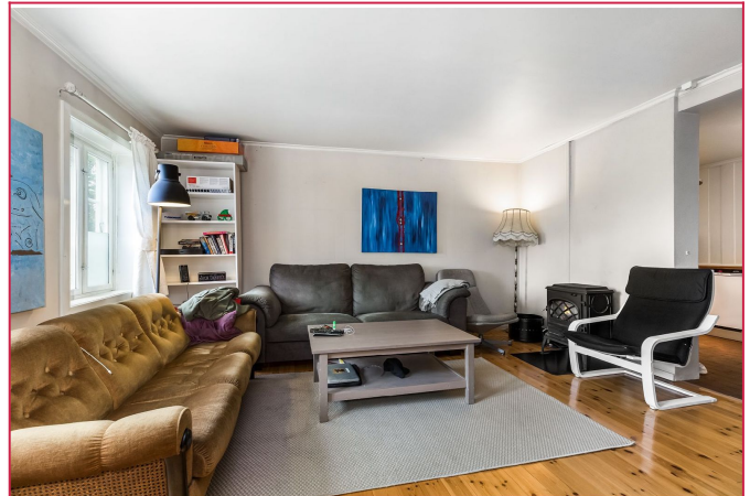
Romslig stue med peis