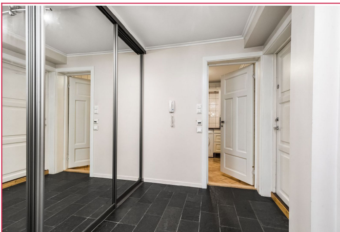
Velkommen inn! entre med skyvedørgarderobeskap