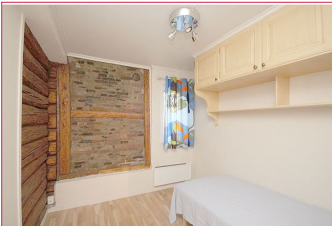
Soverom 2 med seng