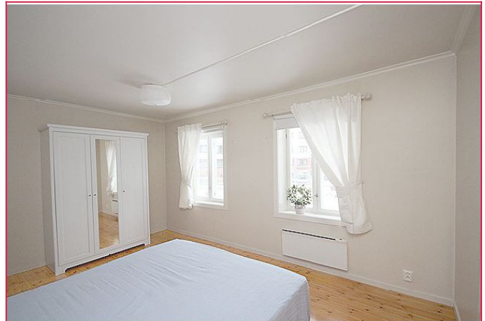
Garderobeskap og dobbeltseng medfølger.