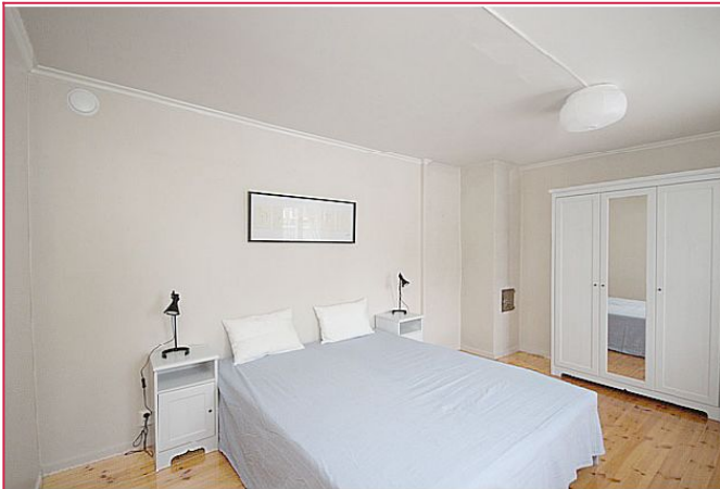
Hovedsoverommet fremstår som lyst og romslig.