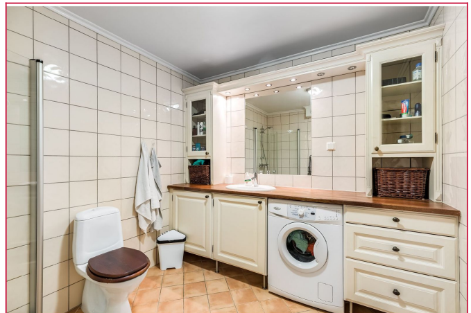
Pent flislagt bad med varmekabler. Vaskemaskin medfølger