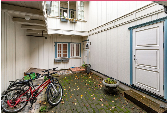
Egen inngang inn til leiligheten