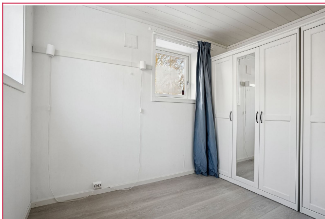
På det andre soverommet er det plass til seng, og det står allerede et garderobeskap.