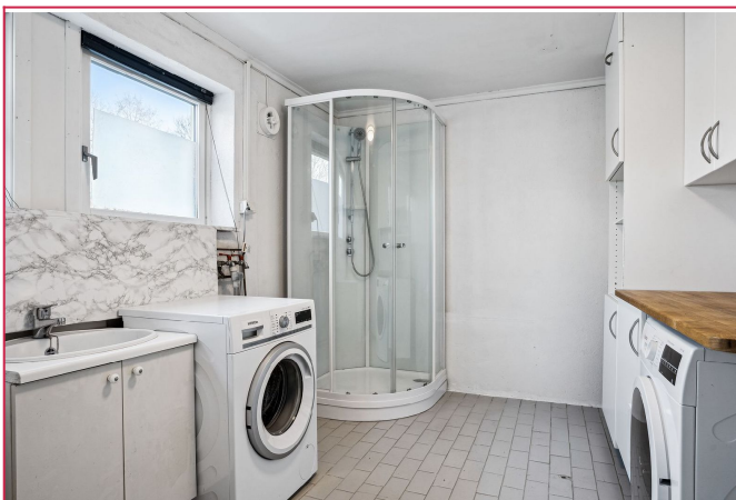
Bad med både tørketrommel og vaskemaskin.