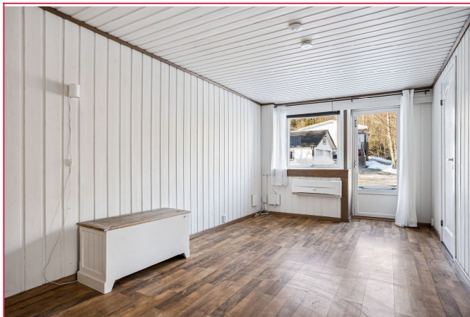
Lys og åpen stue med utgang til gårdsplassen.