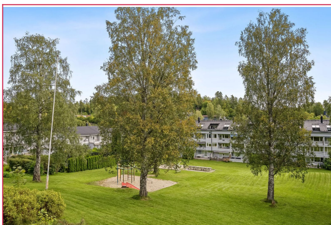
Sameiets fellesarealer med flere sitteplasser.