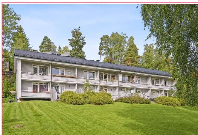
Balkongen får rikelig med sol om sommeren.