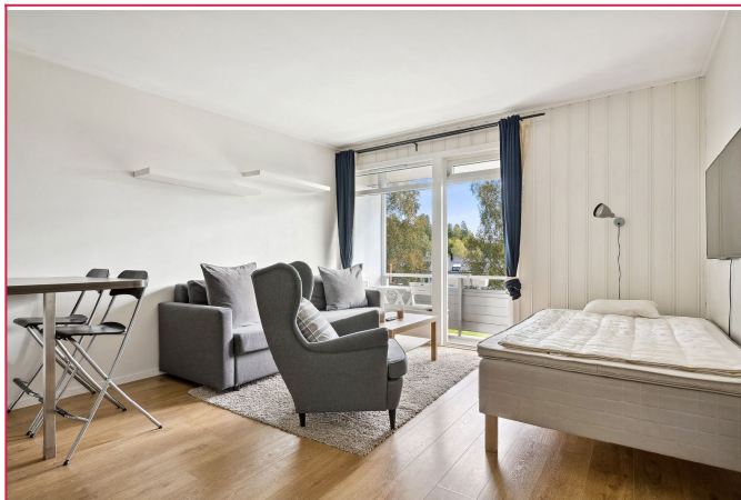
Her får man plass til både sofa, seng og et lite spisebord.