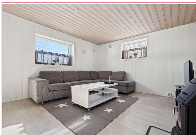
Kjellerstue med vedfyrt peis.