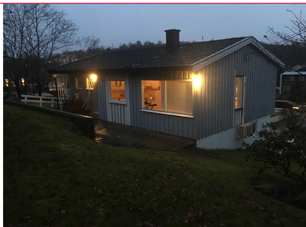
Bakside av huset fra hagen - hovedinngangsdør på midten av huset