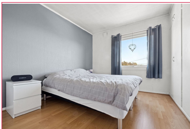
Soverom med god plass til dobbeltseng og innebygget garderobe