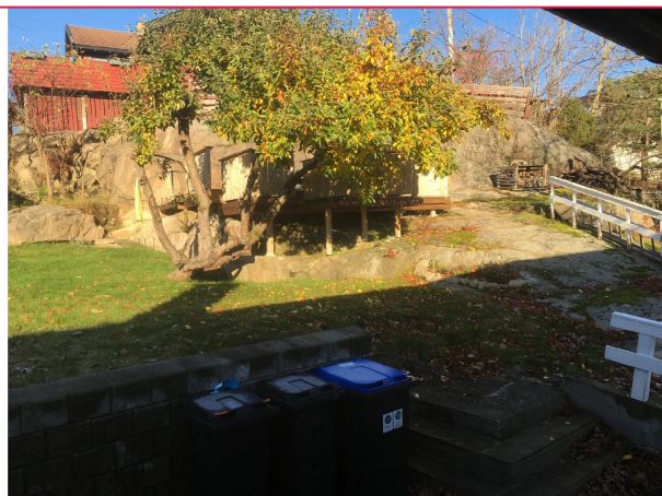
Hage/ platting fra inngangsdør