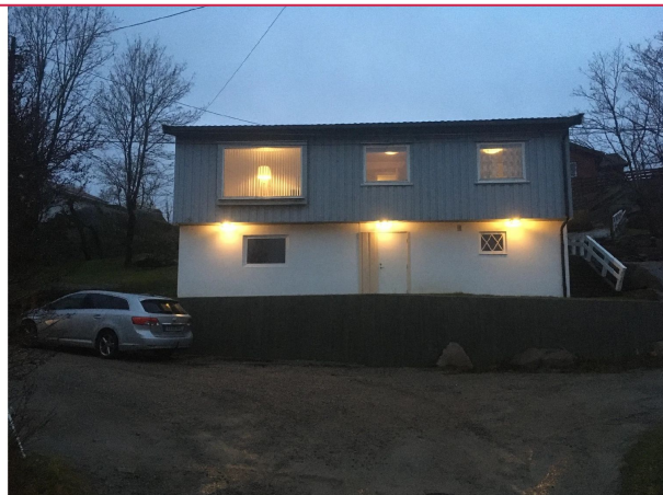
Fremsiden av huset, parkering der bilen står i bildet.