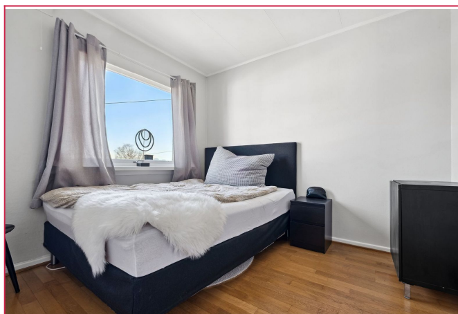
Soverommene har god størrelse.