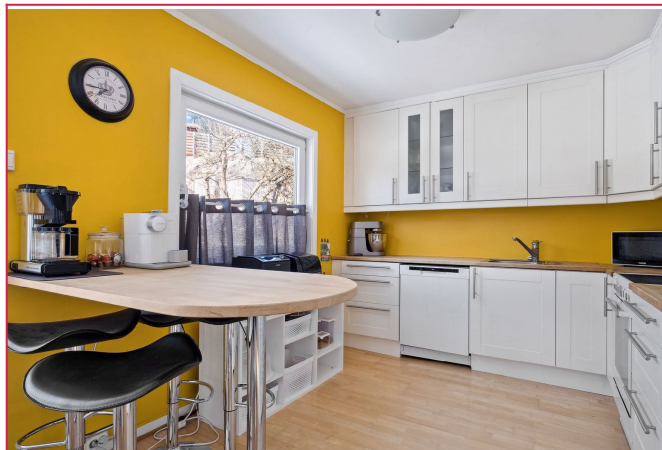
Kjøkken - oppvaskmaskin følger med av hvitevarer.