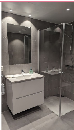
Pent flislagt bad med opplegg for vaskemaskin