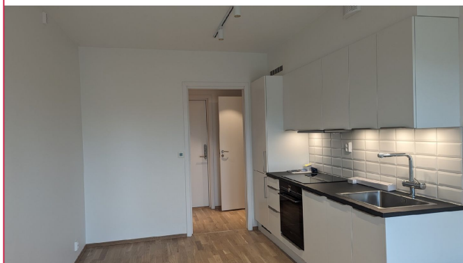
Stue/kjøkkenen i åpen løsning