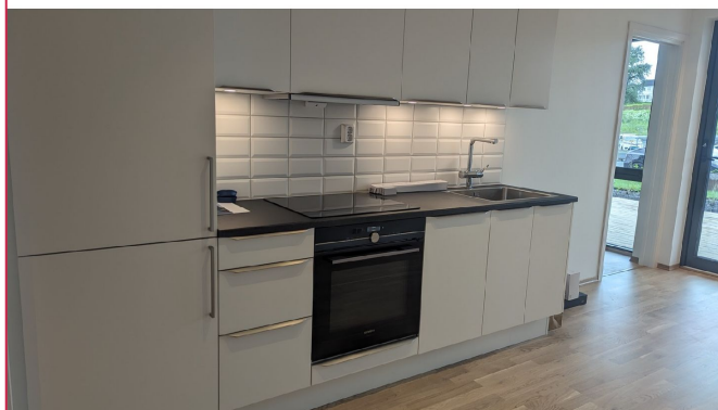
Lyst og pent kjøkken med integrerte hvitevarer