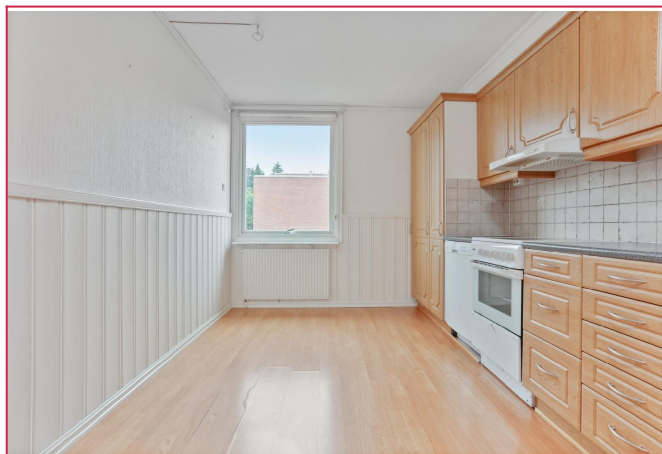
Separat kjøkken med komfyr og oppvaskmaskin