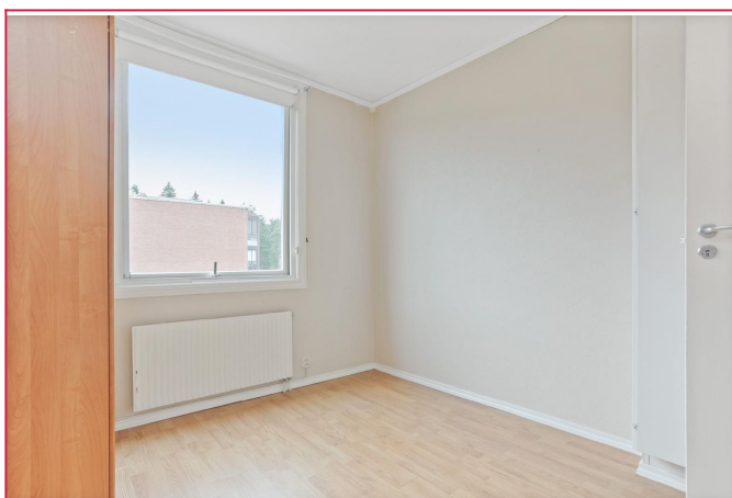
Soverom 1 med garderobe, adkomst gjennom badet