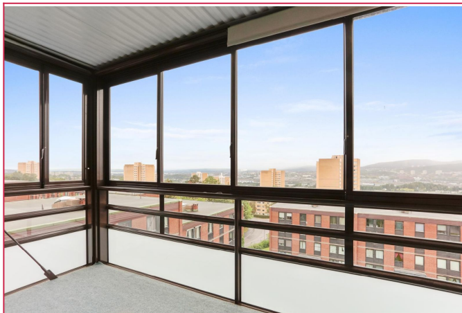
Innglasset balkong med utgang fra stuen