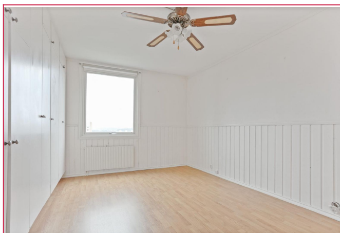
Soverom 2 med garderobe