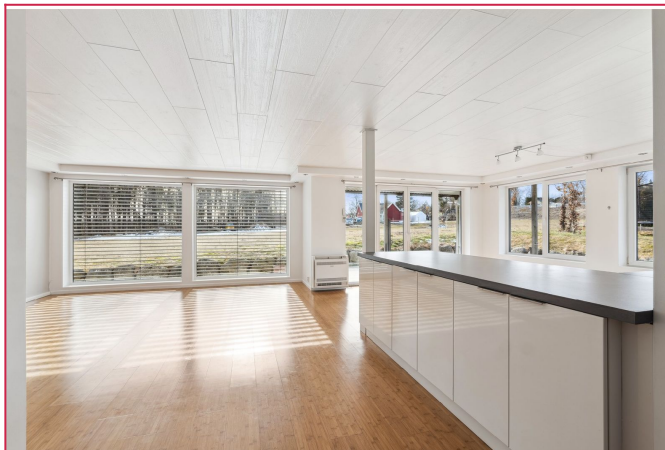
Åpen stue- og kjøkkenløsning