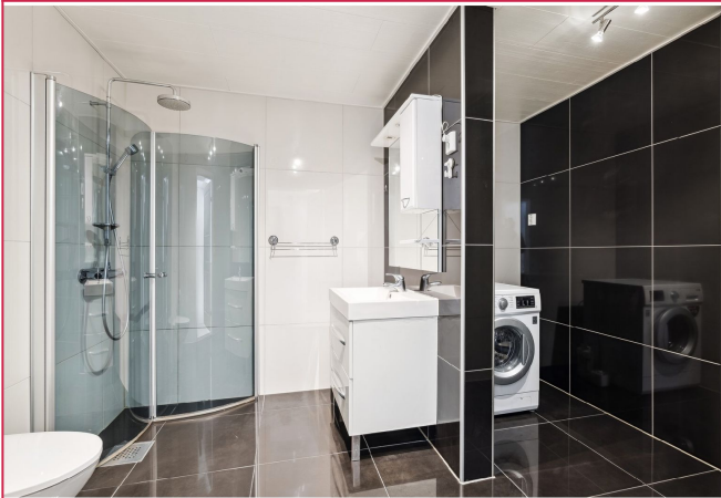
Pent flislagt bad. Vaskemaskin følger med