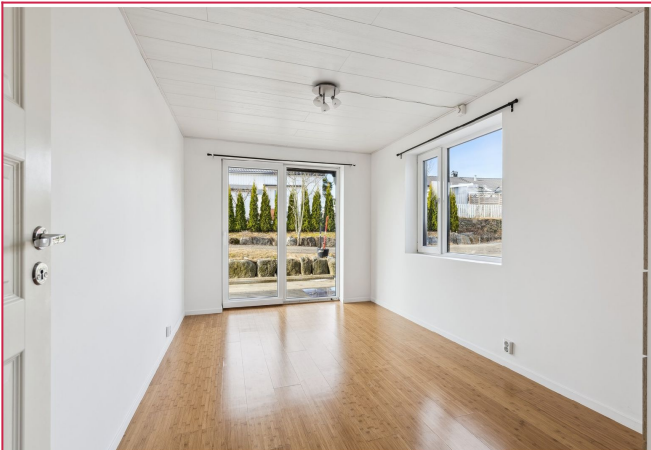
Hovedsoverom med utgang til terrasse