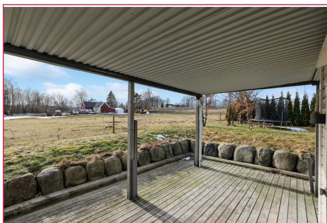
Stor overbygget terrasse som går over 2 sider av bygget