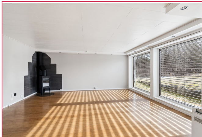
Peisovn, varmepumpe. Vinduene har utvendig solskjerming