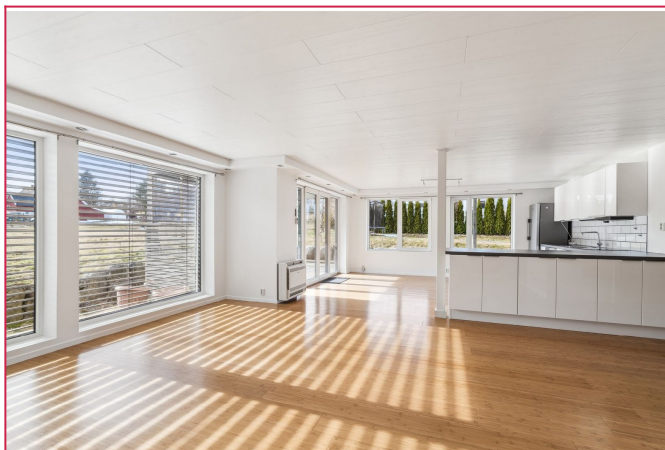
Åpen stue- og kjøkkenløsning