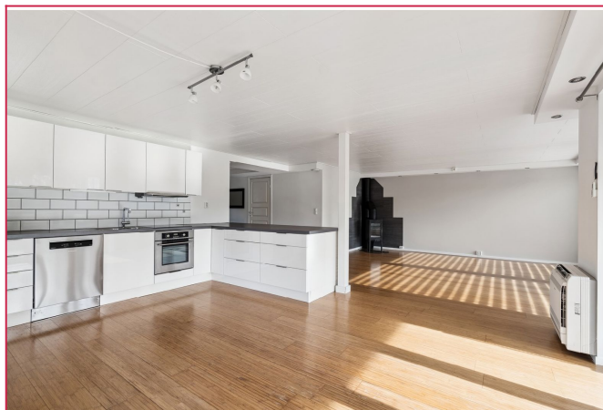
Åpen stue- og kjøkkenløsning