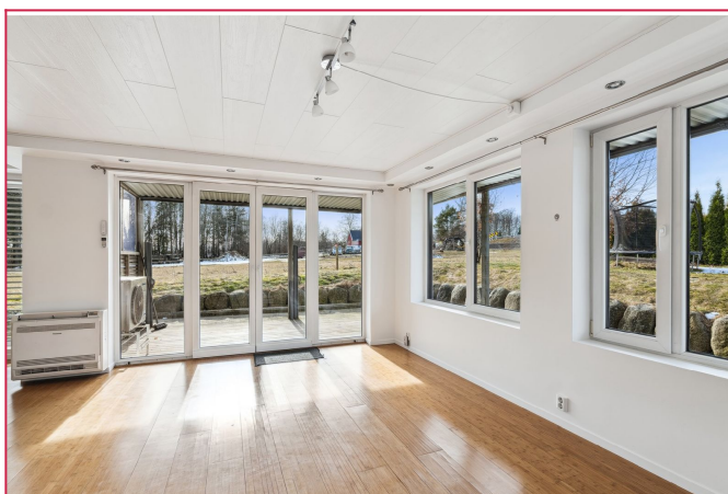
Direkte utgang til overbygget terrasse