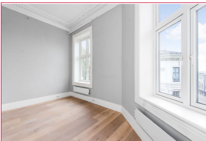
Lyst og luftig soverom