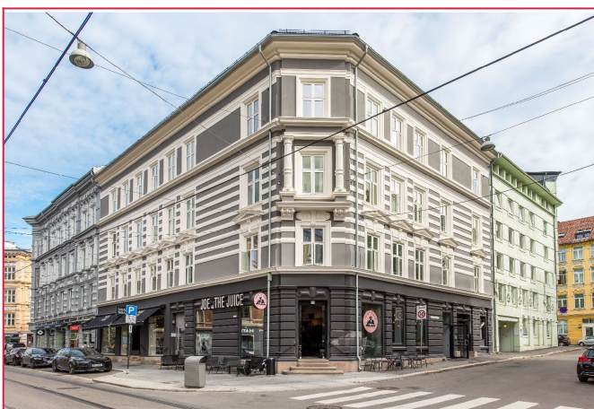
Velkommen til Bogstadveien 21