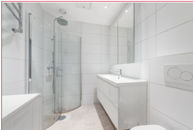
Lekker flislagt bad

SAKSNUMMER 50582 - BOGSTADVEIEN 21, 0355 OSLO