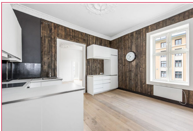
Moderne kjøkken med integrerte hvitevarer