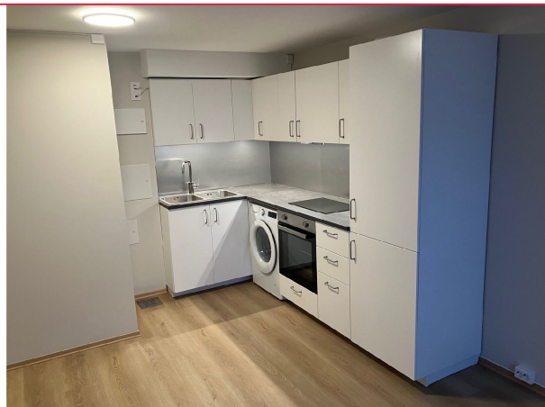
Helt nytt kjøkken med integrert hvitevarer