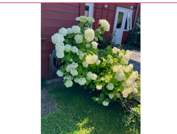
Leietaker disponerer hagen utenfor leiligheten