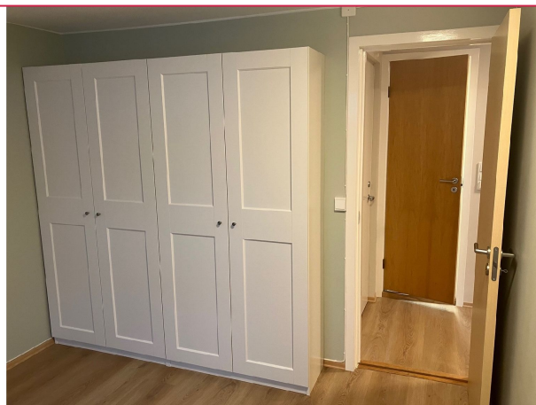
God garderobeplass på soverommet