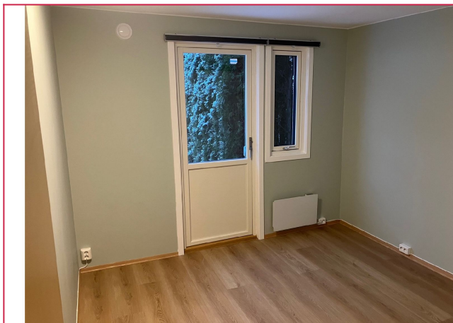
Soverom med utangsdør til hagen