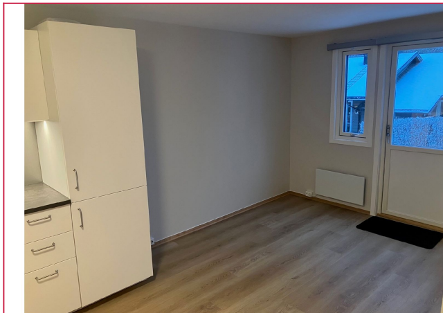
Åpen kjøkken og stue løsning, inngang direkte fra hagen.