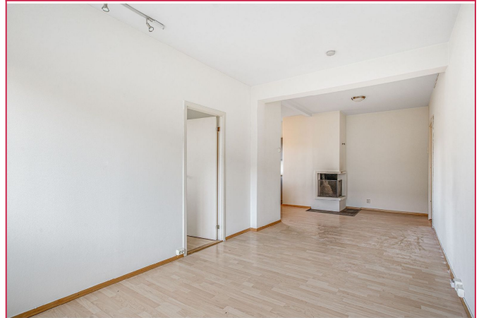
Romslig stue med gode møbleringsmuligheter