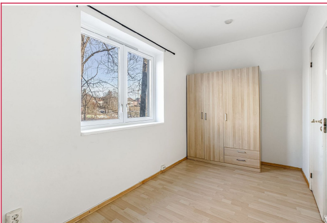
Garderobeskap på soverom medfølger