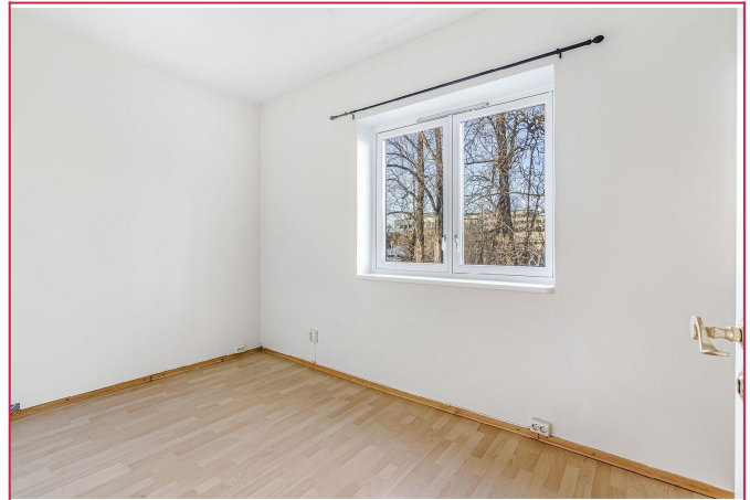
Lyst og romslig soverom med garderobeskap