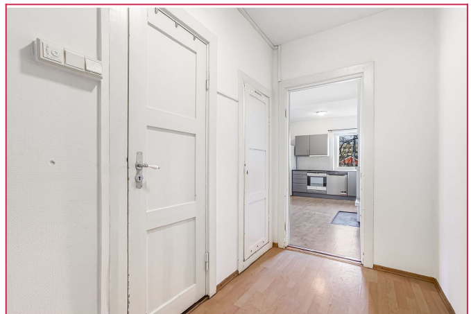
Velkommen inn! Entre med innvendig bod