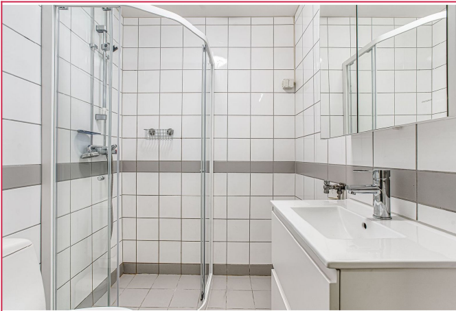
Pent flislagt bad