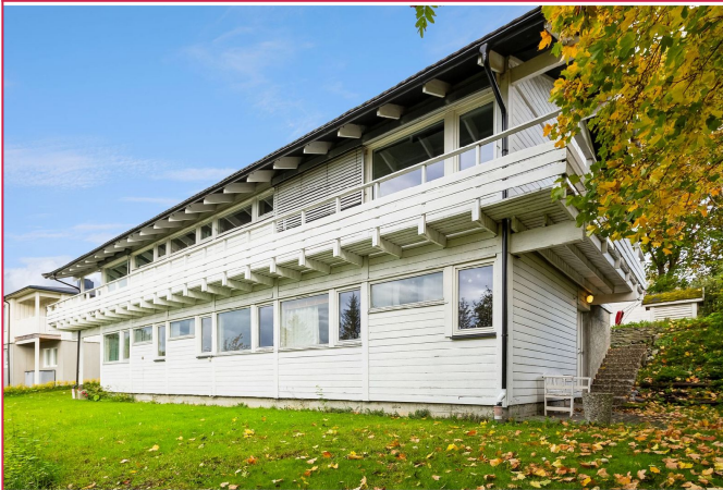
Velkommen til Prestekragevegen 25! Et hyggelig kollektiv med attraktiv beliggenhet på Moholt