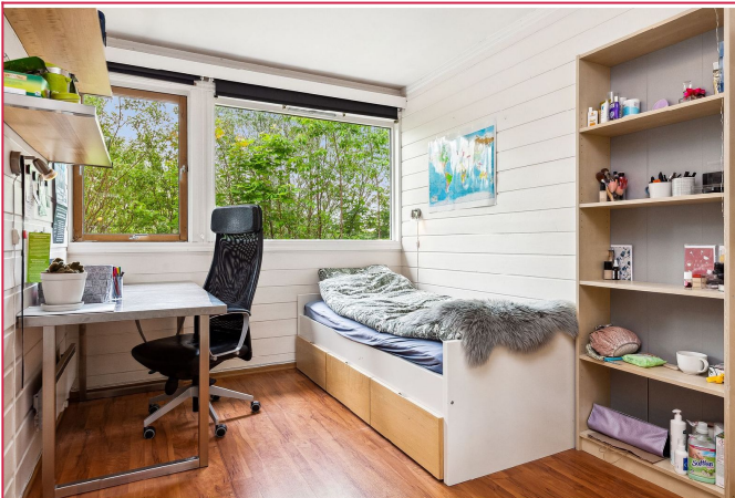
Rommene i boligen er på 10 og 10,5 kvm