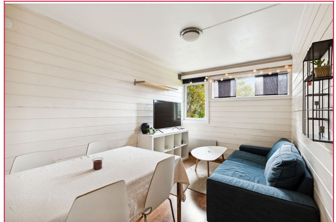
Kollektivet har også en hyggelig stue til sosiale sammenkomster - Her får du alt inkludert i leien