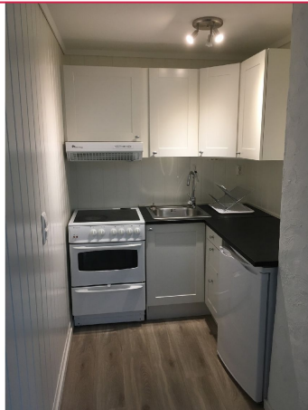
Kjøkkeninnredning i hvite fronter. Hvitevarer: Komfyr, kjøleskap