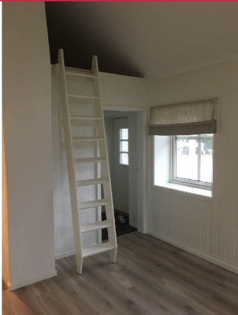
Enebolig beliggende i fine omgivelser!