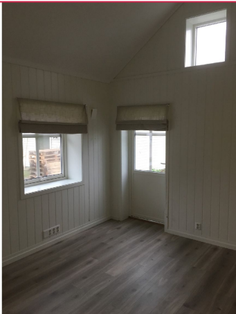
Stua har god takhøyde og direkte utgang til fin uteplass!