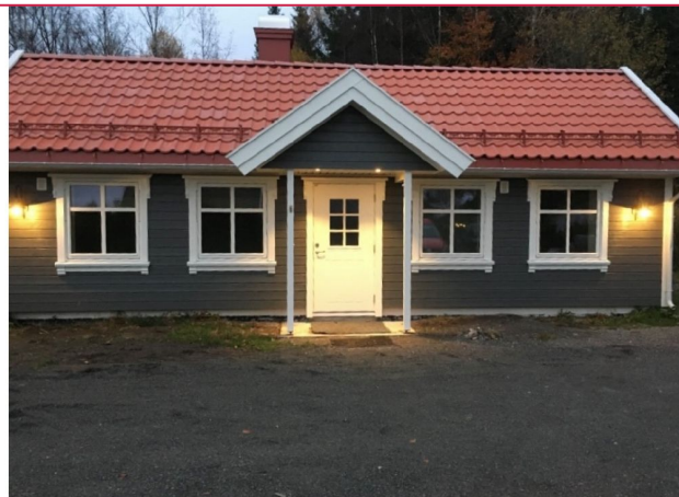
Velkommen til visning!