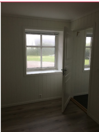
Soverommet er av god størrelse og har plass til dobbeltseng.