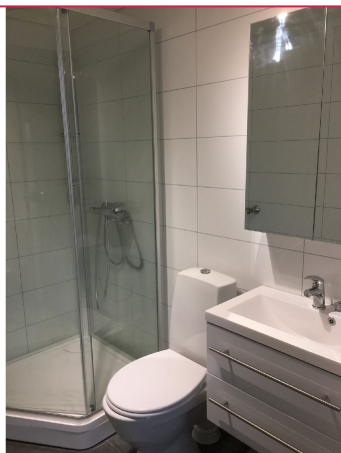
Pent bad med flislagte gulv og vegger. Toalett, dusjkabinett og servant med innredning.