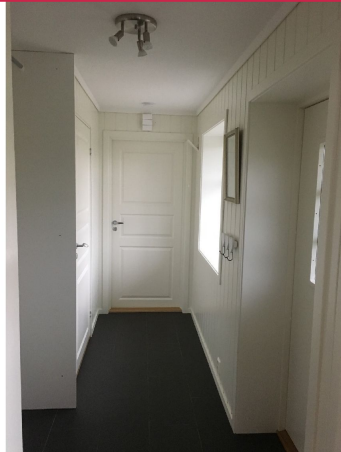
Lys og trivelig gang. Det er satt inn skyvedørgarderobe med speil til venstre.