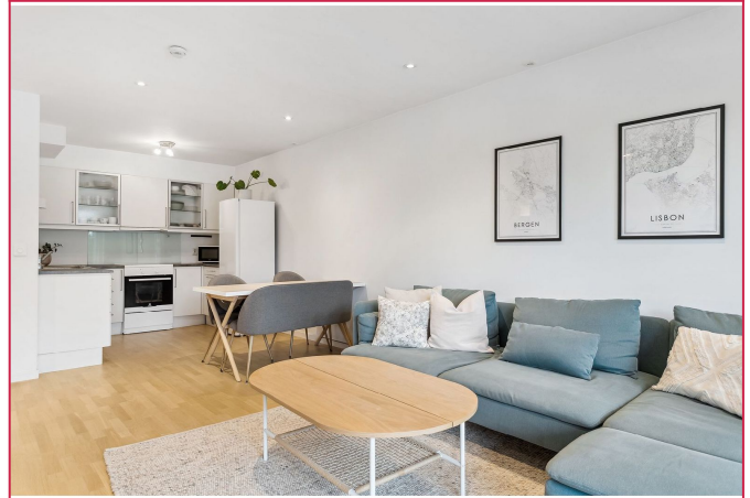
Stue med åpen kjøkkenløsning