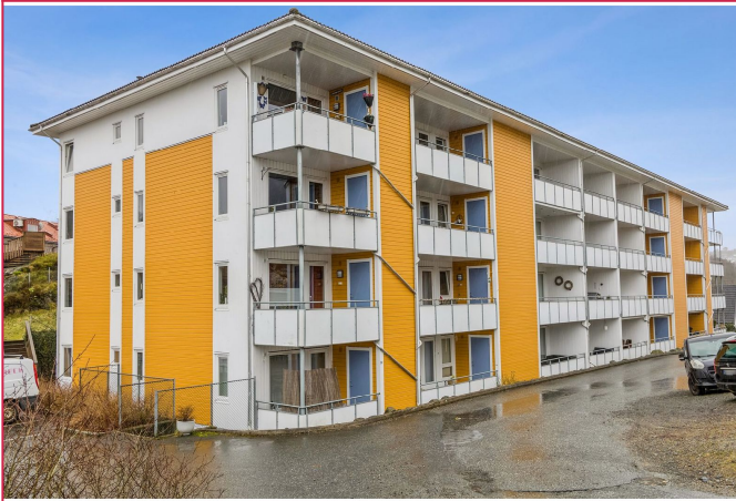
Velkommen til Gravdalsveien 35C