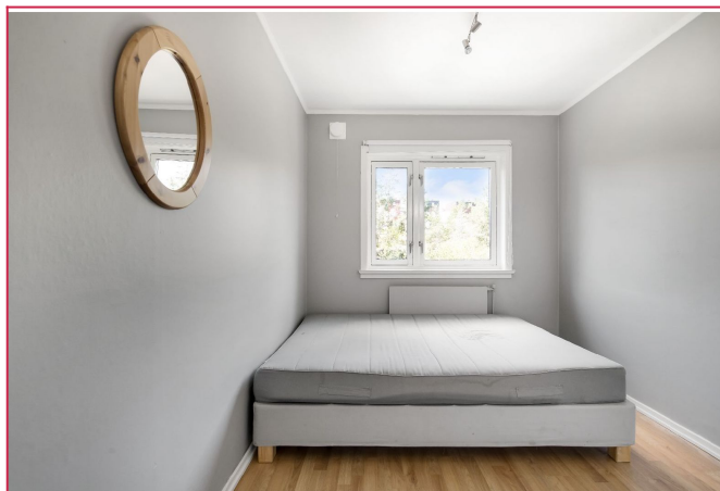
Soverom med garderobeskap.