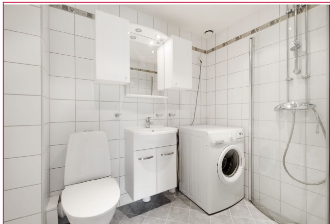
Flislagt bad med vaskemaskin og varmekabler.