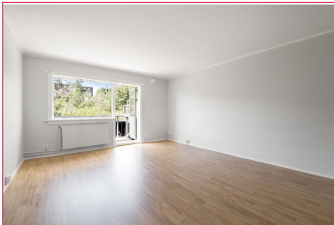
Velkommen til Libakkfaret 11A