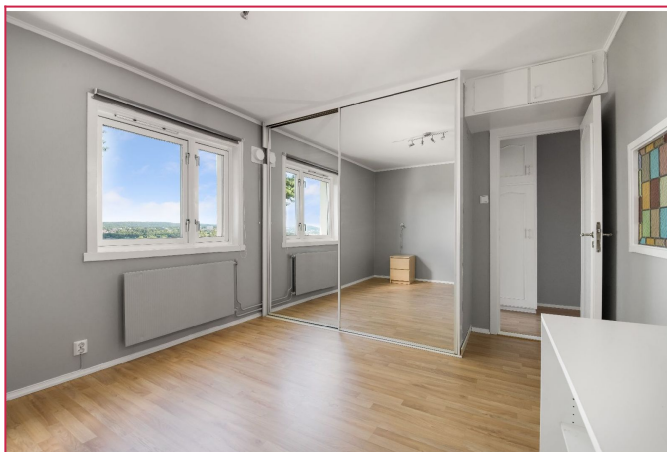
Soverom med god plass til dobbeltseng.