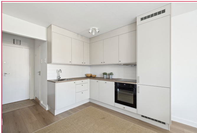
Stilrent kjøkken med lyse fronter og integrerte hvitevarer.