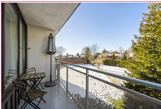
Overbygget balkong med plass til møbler og grønn utsikt.