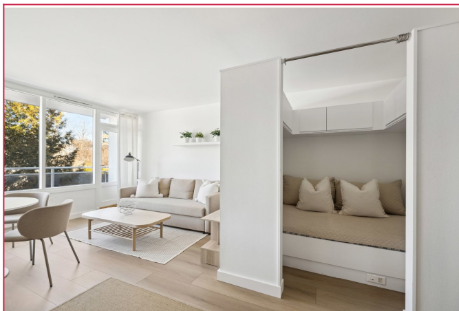
Skjermet alkove med seng og innebygde skap.