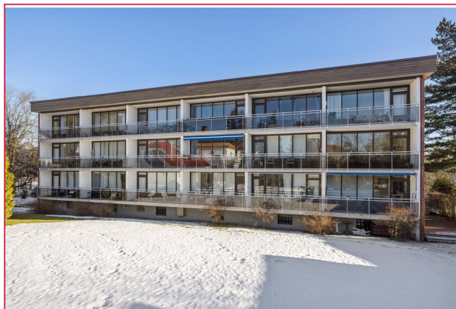
Bygg med store glassvinduer og balkonger i rolig område.