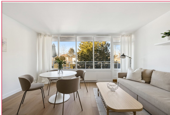
Stor stue med utgang til balkong og mye naturlig lys.