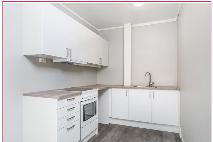
Åpen kjøkkenløsning mot stuen