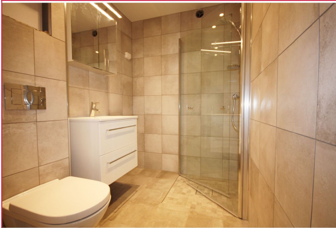
Bad med varme i gulv, vegghengt toalett, servant, dusj og opplegg for vaskemaskin