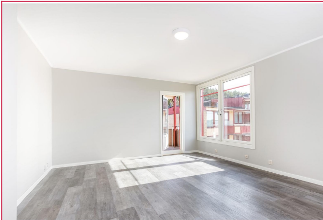
Stue med utgang til balkong