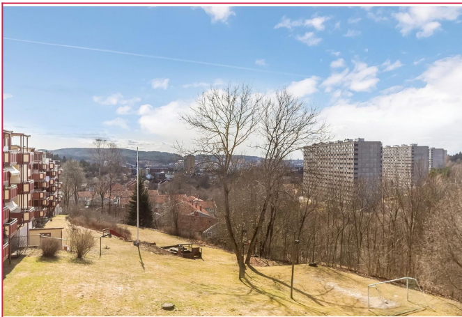
Svært god utsikt fra balkong, stue og soverom 2