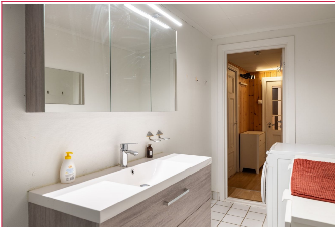
Bad med vaskemaskin