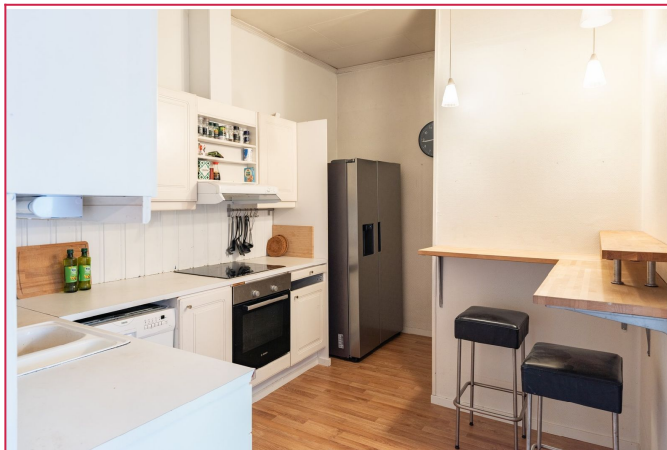
Leiligheten ligger i øverste etasje og har internett inkludert i leien.

SAKSNUMMER 64837 - INNHERREDSVEIEN 22 A, 7042 TRONDHEIM