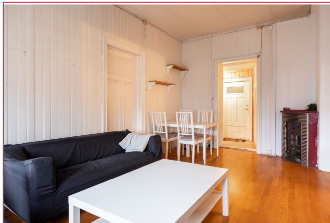
God takhøyde og sentral beliggenhet.