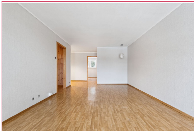
Stuen har god plass til både sofakrok, mediebygg og spisestue