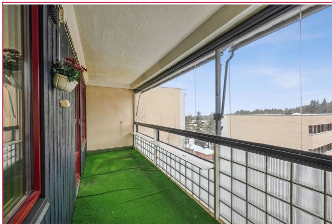
Fra stuen er det utgang til innebygd balkong på ca 12 kvm med gode solforhold