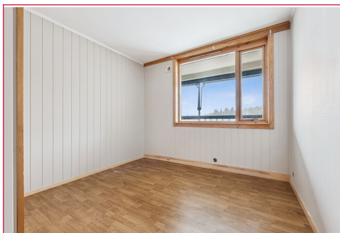
Hovedsoverom - leiligheten har totalt 3 soverom - Medfølger garderobeskap