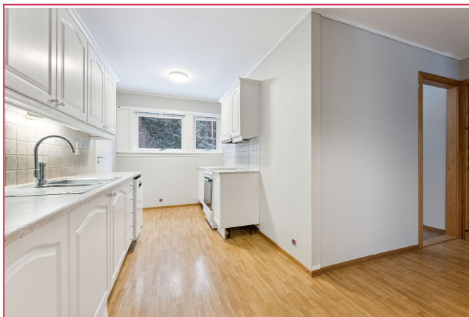
Kjøkkenet ligger i delvis åpen løsning til stuen og har godt med skap- og benkeplass