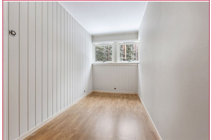
Soverom/kontor - medfølger garderobeskap