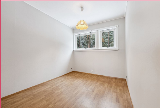
Soverom 2 er også av god størrelse med plass til dobbeltseng og tilhørende møblement