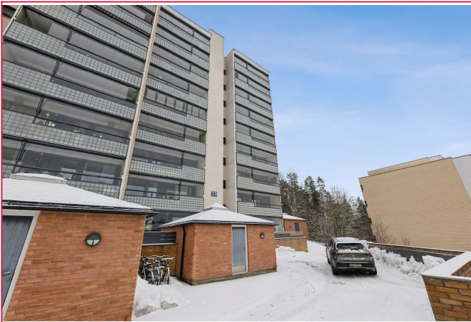
Fasade - Bygget har god intern beliggenhet i borettslaget