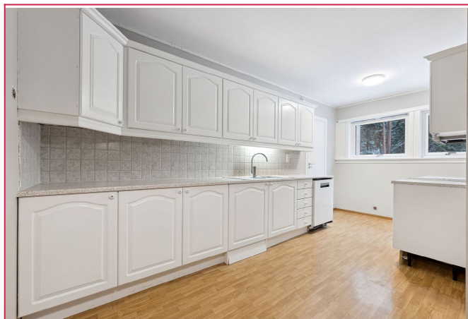
Det medfølger oppvaskmaskin og komfyr