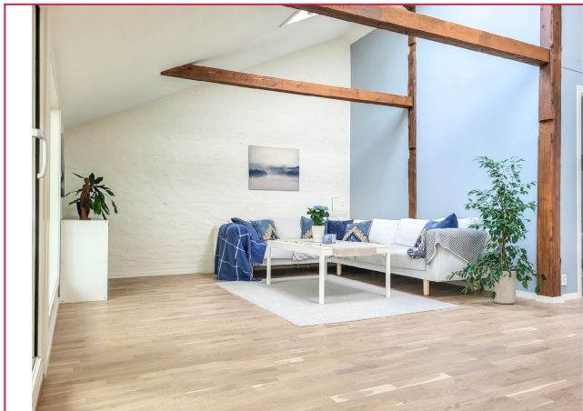
Denne romslige stuen med peis og 3,3 meter takhøyde skaper en innbydende atmosfære.