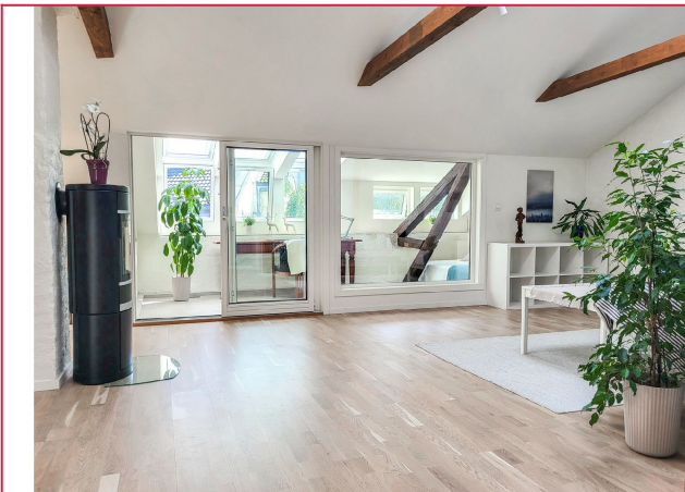
Med direkte adkomst til vinterhagen, tilbyr denne stuen en sømløs overgang mellom inne- og uterom.