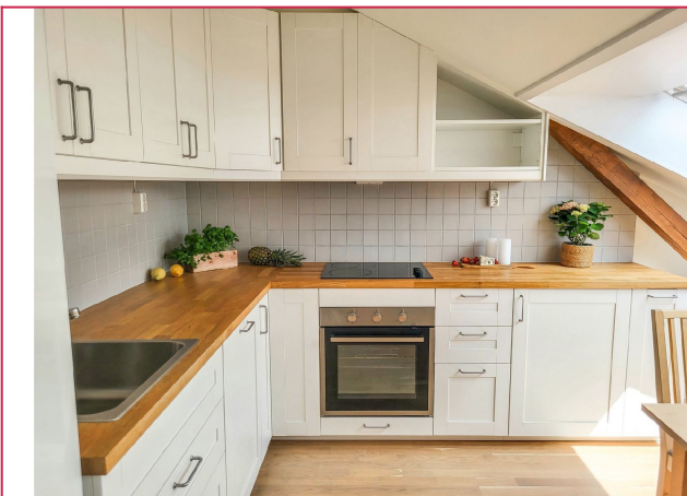
Med lyse overflater og åpen løsning mot stuen.