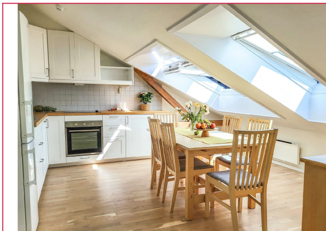
Det åpne kjøkkenet har moderne hvitevarer og god plass til et spisebord.