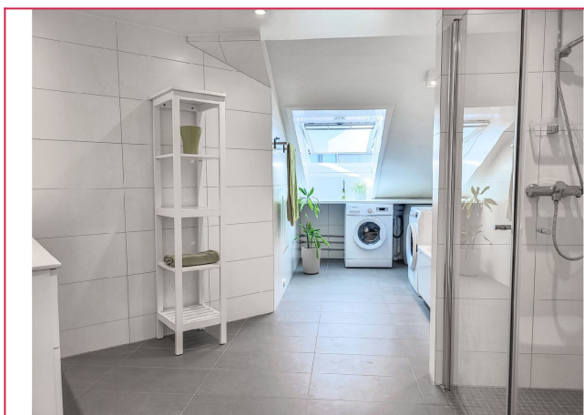
Det imponerende 13 kvm badet har både badekar og dusj, samt vaskemaskin og tørketrommel.