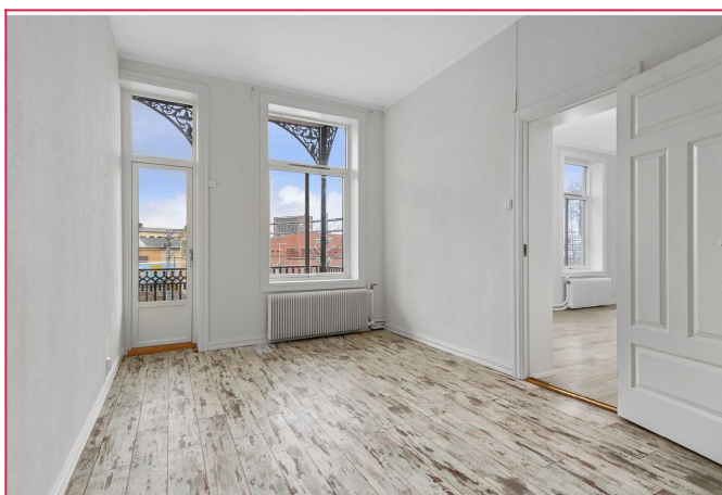
Soverommet er stort og har god plass til stor seng og kontor, samt garderobeskap.