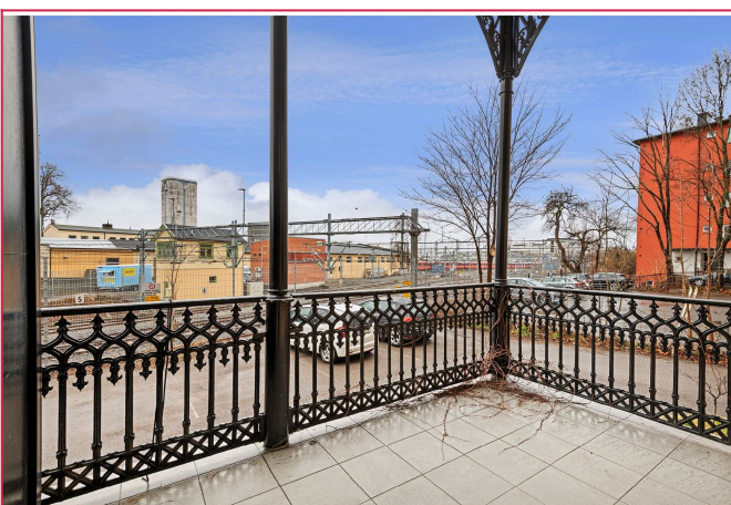
Sydvestvendt balkong. Beliggende nær Aker Brygge, Tjuvholmen og Solli plass.