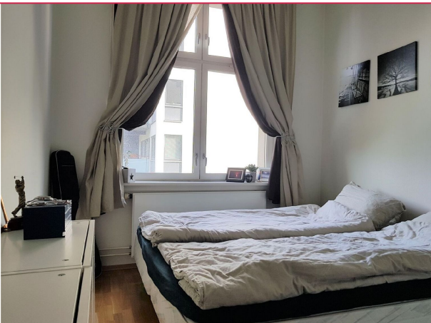
Soverom med god plass til dobbeltseng.