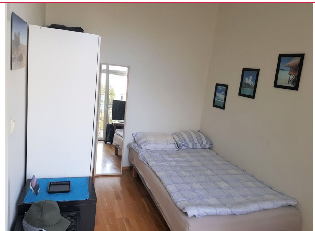
Soverom med plass til seng.