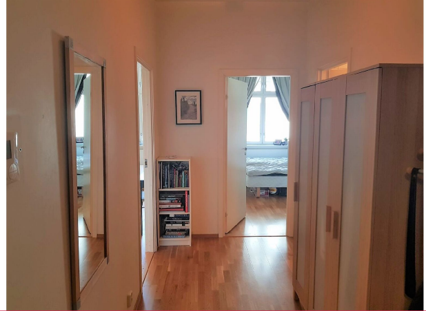
Entrè med god plass til klær og sko.