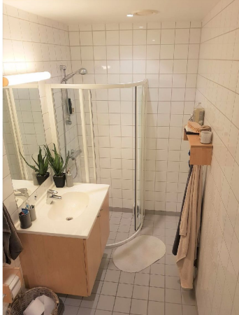
Pent flislagt bad med varmekabler.