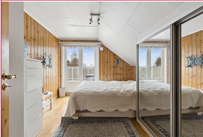
Hovedsoverommet fremstår som lyst og romslig med stor skyvedørgarderobe