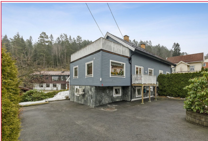
Velkommen til Venåsvegen 42 A!