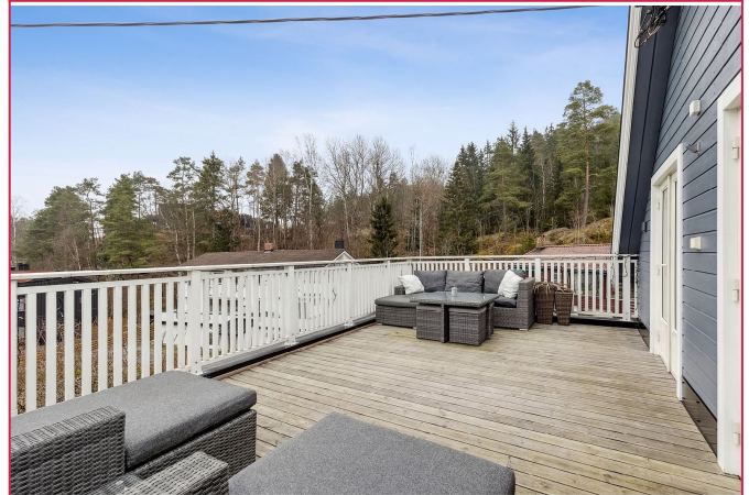
Stor terrasse med god plass til utemøblement og grill