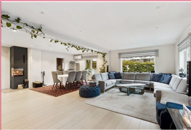
Innbydende stue med gode møbleringsmuligheter