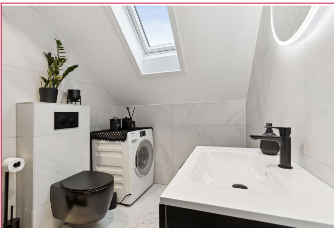
Pent flislagt bad med varmekabler. Vaskemaskin medfølger