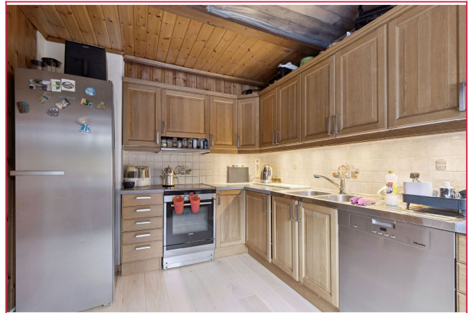
Romslig kjøkken med hvitevarer