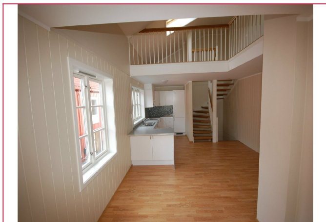
Kjøkken / spisestue