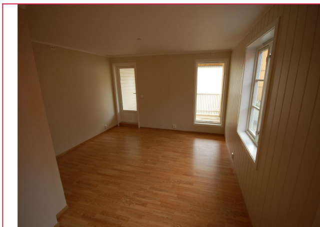
Stue med utgang til veranda