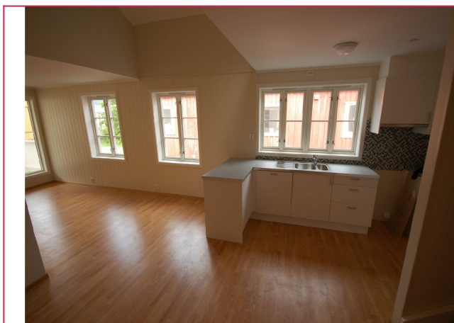
Kjøkken / stue