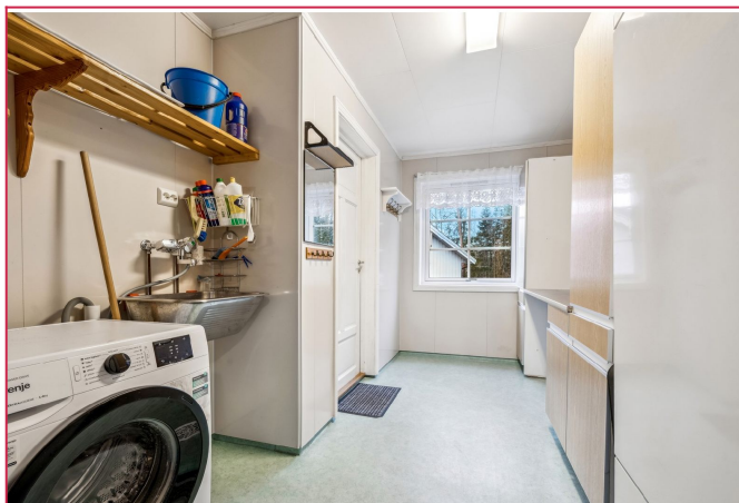
vaskerom med vaskemaskin og ekstra hvitevarer som kjøll og frys