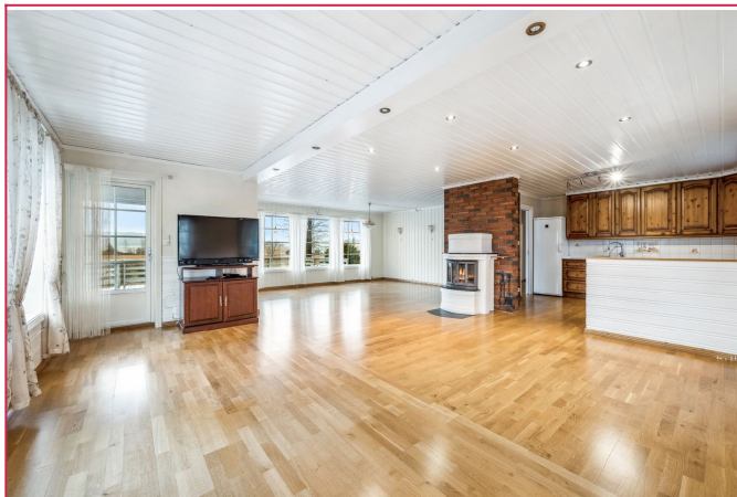
Stor stue med 2 peiser og tv. TV/Internett er lagt frem til vegg.