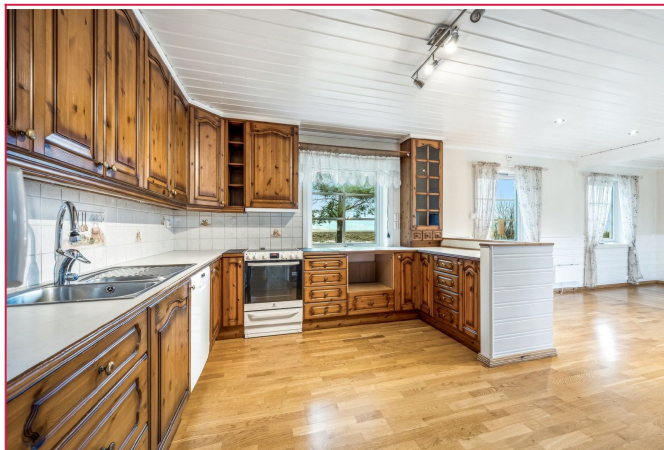
Stort kjøkken med frittstående hvitevarer og en kjøkkenøy. Frittstående hvitevarer medfølger