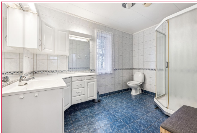
Romslig bad med dusjhjørne