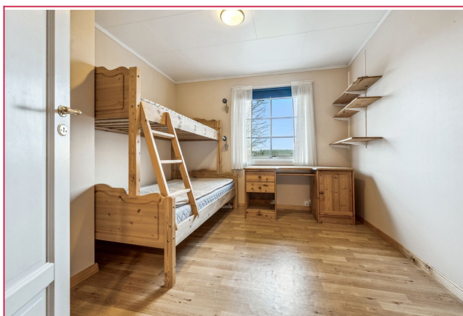
Soverom med seng og pult. Fleksibel på møbleringen