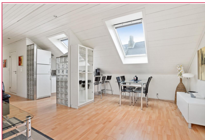
Spisestue og kjøkken