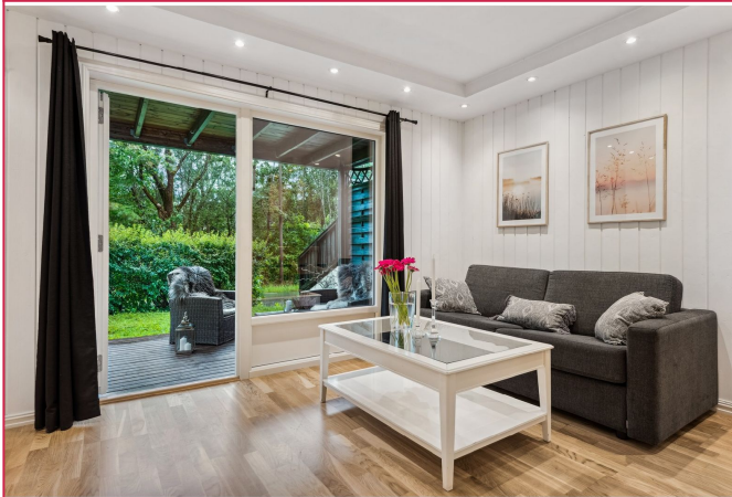
Stue med utgang til terrasse