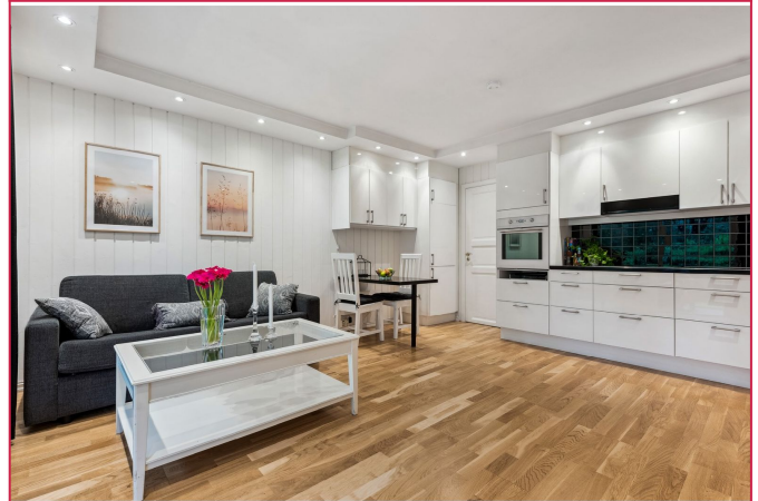
Stue mot spise plass