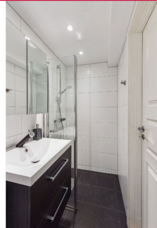
Bad med dusjhjørne