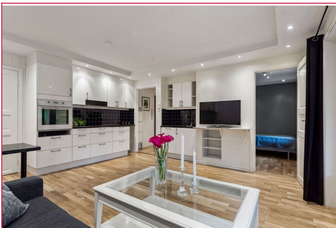
Stue mot soverom